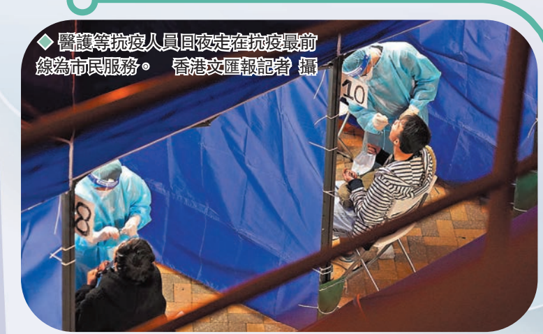
◆醫護等抗疫人員日夜走在抗疫最前線為市民服務。