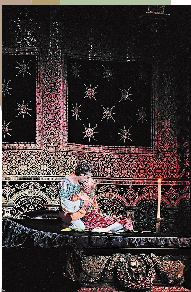
◆《羅密歐與茱麗葉》