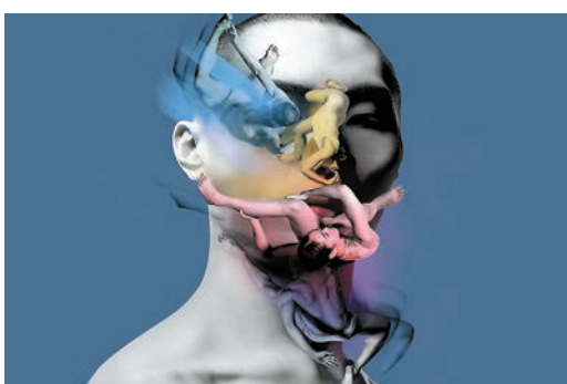
◆雲門舞集 鄭宗龍《霞》

斯風演出改編的巴赫《無伴奏大提琴組曲》，這個改編版本保留了核心旋律，但加上了吹奏管樂獨有的呼吸、節奏，銅管的金屬光澤與木管的素樸交織，音樂滿溢着褪去了神聖感的人味，正與鄭宗龍要的舞作感覺相呼應。