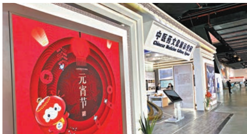
◆北京冬奧會主媒體中心的「中醫藥文化展示空間」。

張伯禮介紹，中醫藥的「三藥三方」——金花清感顆粒、連花清瘟膠囊、血必淨注射液和化濕