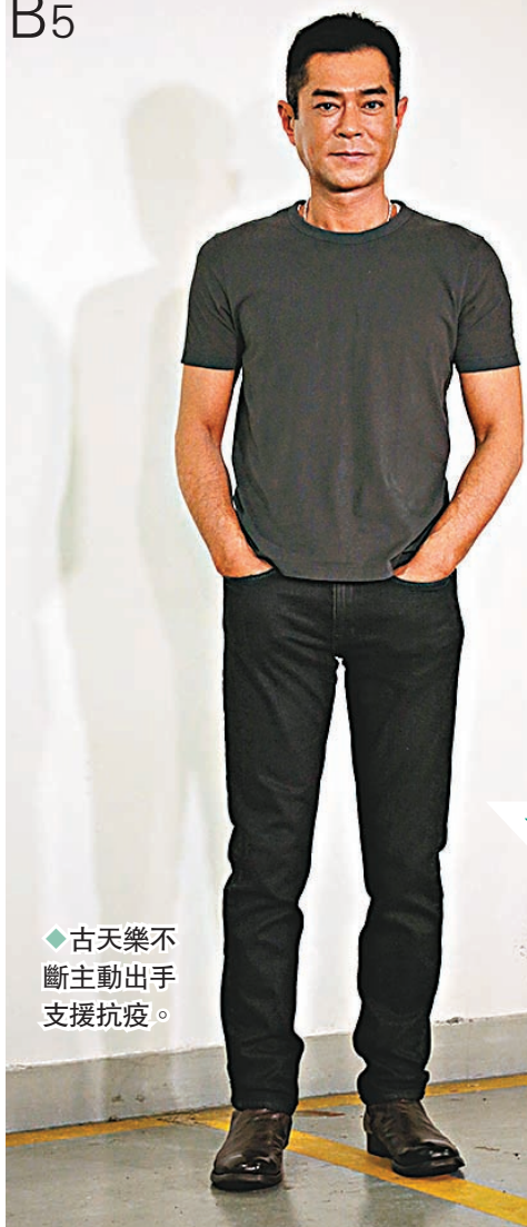
◆古天樂不斷主動出手支援抗疫。

香港文匯報訊(記者 李思穎、阿祖、達里)香港正受第五波疫情影響,各界奮力抗衡,演藝界亦不遺餘力,一向熱心公益的古天樂加碼再捐出5,000套快速檢測包予社福機構。歌手安俊豪和女演員張敬仁以「愛心大使」身份出席慈善抗疫活動,支持向基層人士派發快速檢測包,由於目前確診數字高企,大會暫時採取無接觸派發方法,待數字回落,安俊豪和張敬仁都希望可以親自落區派發相關物品。張敬軒則勉勵大眾要保持樂觀,正面地了解疫症的相關知識和療法,不必過於擔心。