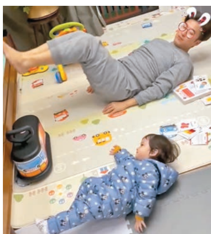
◆陳山聰相信齊心抗疫,就可擁有生活一點甜。