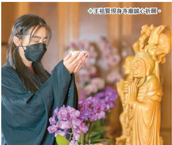
◆王祖賢現身寺廟誠心祈願。

香港文匯報訊(記者 李思穎)息影多時的王祖賢移居到加拿大生活,近年潛心修佛的她,最近被發現在海外一間寺廟出現,但見伊人在佛前誠心祈福,原來是祈求疫情早日消失,大家重回健康生活,向善之心值得讚許。