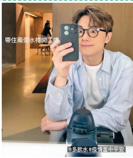
◆軒仔表示已準備重新投入工作。