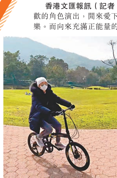
◆余安安去到郊外,鬱悶一掃而空!

香港文匯報訊(記者 阿祖)余安安多年來生活也很愜意,會選擇喜歡的角色演出,閒來愛下廚整蛋糕甜品,之前更榮升外婆,可以弄孫為樂。而向來充滿正能量的她,最近卻因前輩導演楚原的離世以及嚴峻疫情,影響到情緒有點低落,但她仍找方法讓自己的開心指數提升,並跟大家分享:「非常正能量的我,這兩天情緒都有少少影響!朋友邀請去郊遊!果然跑吓步,踩吓單車,感覺非常良好!開心指數上升返!鬱悶一掃而空!」余安安表示,記錄跑步里數還可以做善事,她也會分享一些疫情下安全的跑步方法,因為運動好重要,可以吸收維他命D,又可以發放快樂因子多巴胺,從而發放更多正能量!