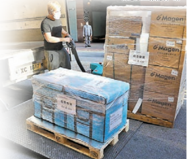
◆貨車將國藥控股廣州有限公司應急物資運到專家組下榻酒店門外卸卸。