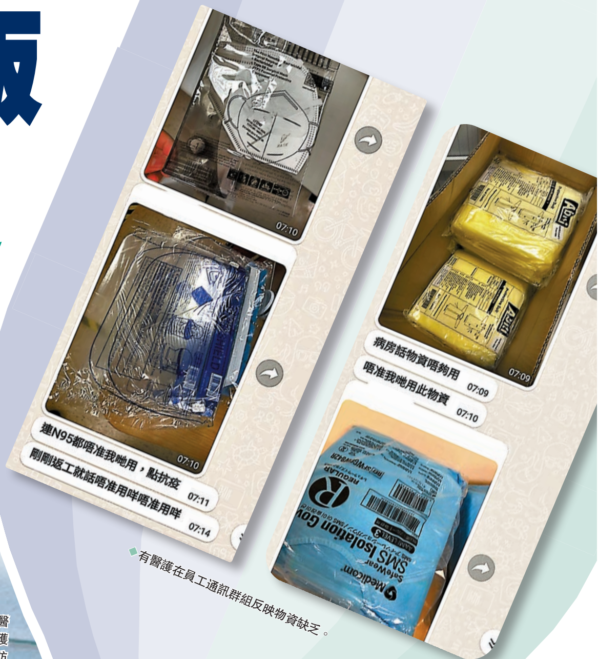
◆有醫護在員工通訊群組反映物資缺乏。