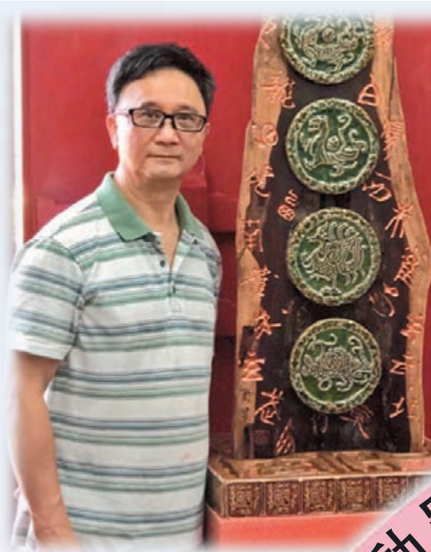
◆木雕刻家西星製作了《同心抗疫 四方平安》的陶印作品。