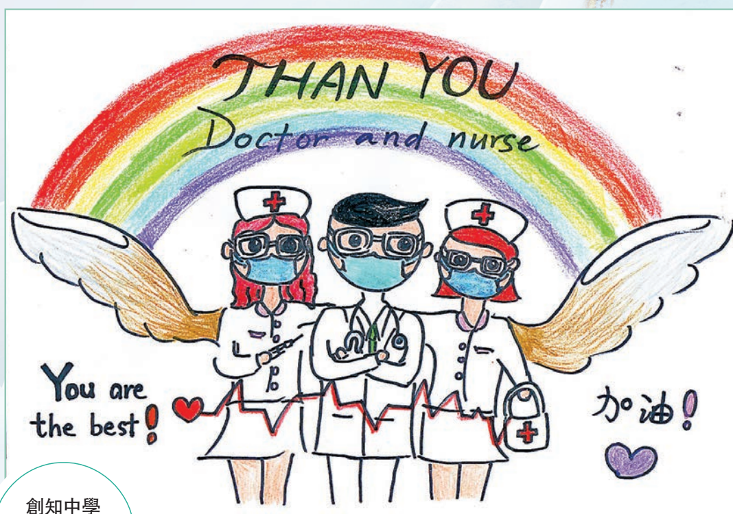
創知中學 中三仁班學生 陳藹晴