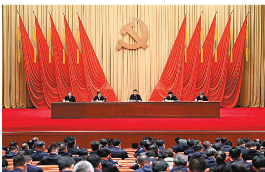
◆3月1日，習近平在中央黨校（國家行政學院）中青年幹部培訓班開班式上發表重要講話。

習近平指出，樹立和踐行正確政績觀，起決定性作用的是黨性。只有黨性堅強、摒棄私心雜念，才能保證政績觀不出偏差。共產黨人必須牢記，為民造福是最大政績。我們謀劃推進工作，一定要堅持全心全意為人民服務的根本宗旨，堅持以人民為中心的發展思想，堅持發展為了人民、發展依靠人民、發展成果由人民共享，把好事實事做到群眾心坎上。什麼是好事實事，要從群眾切身需要來考量，不能主觀臆斷，不能簡單化、片面化。哪裏有