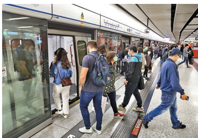
◆因應疫情嚴峻，港鐵由明天起調整8條鐵路線的班次，候車時間會較現時長約1分鐘至4分鐘。圖為市民乘坐港鐵出行。

香港文匯報訊（記者 文森）疫情蔓延各行各業，在公共交通方面，昨日有多項交通工具營辦商宣布因為染疫員工眾多，影響交通服務。其中，港鐵公司表示，昨日再多168宗涉及車務及維修員工及承辦商人員確診感染新冠肺炎，使第五波疫情共約1,500名員工確診，導致車務人手緊張，明天（4日）起，調整8條鐵路線；東鐵線於周末及公眾假期的列車班次亦會調整。調整班次後，受影響鐵路線大部分乘客在繁忙及非繁忙時段的候車時間會較現時延長約1分鐘至4分鐘。