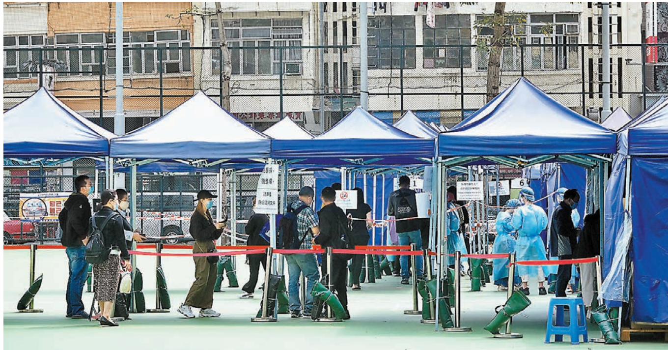
◆林鄭月娥強調，進行全民強檢的過程、範圍和程度，都要考慮香港實際情況和市民的需要，強調特區政府不會推行全面「禁足」。圖為市民昨日到旺角一個檢測站排隊做檢測。