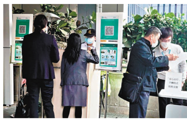
◆現時公務員進入政府大樓和辦公處所工作，均需先掃描「安心出行」程式。

香港文匯報訊（記者 文森）「疫苗通行證」已於上月實施，為加強政府僱員的防疫屏障，保障市民，公務員事務局證實，政府已修訂政府僱員進入政府大樓和辦公處所的「疫苗通行證」安排，最新安排下，除持有豁免證明書，所有因工作目的進入政府大樓及辦公處所的政府僱員，均須於4月1日前完成接種第二劑新冠疫苗；並於5月16日前，或接種第二針後8個月內，須接種第三劑疫苗。