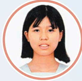
聖士提反堂中學 中三丙