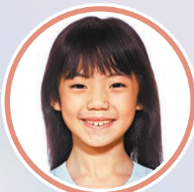
福建中學附屬學校 3P