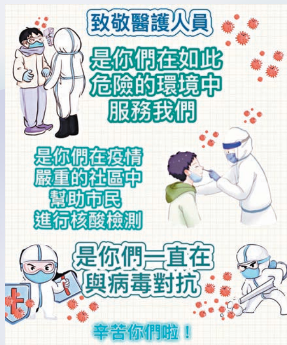
聖公會天水圍靈愛小學 6E

疫情嚴重，急症室的醫護人員不眠不休，搶救生命，我們要為他們加油。各位醫護人員，謝謝您們！