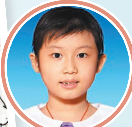
聖公會置富始南小學3D