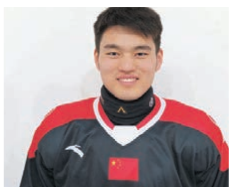
▲國家冰球男選手汪之棟。