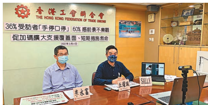
◆工聯會促請特區政府增設失業或停工現金津貼。

香港文匯報訊（記者 文森）第五波疫情席捲全港，多個行業被迫停業或減少營業時間，亦有大型連鎖商舖關店。工聯會上月底進行的問卷調查顯示，近37%人受疫情影響「手停口停」，當中16%人更失業或停工超過一年，整體近20%失業。為支援這些工友的生計，工聯會促請特區政府加大防疫抗疫基金覆蓋面，尤其是為零散工行業的開工不足及停工人士設立現金津貼，每月發放9,000元，為期最長半年。