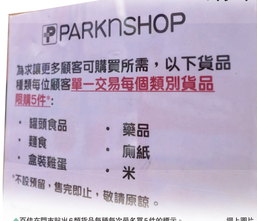
百佳在門市貼出6類貨品每種每次最多買5件的標示。網上圖片

昨日的搶購潮持續，其中位於北角的百佳超級市場，盒裝雞蛋的貨架已被清空，廁紙都被掃光，藥物貨架也空空如也。店方貼出通告，通知顧客6類貨品每種每次最多買5件。