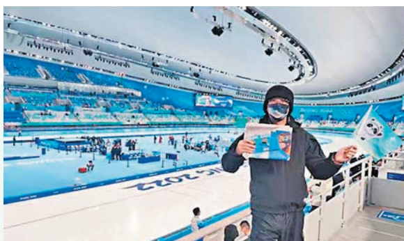
◆筆者在北京體驗冬奧。

再說一下，我們觀賽場地是別名「冰絲帶」的國家速滑館，建築特色是「絲帶」狀的曲面玻璃幕牆，亦是世界最大跨度正交雙向單層膜殼形屋頂。另一個有趣話題，冬奧「冰墩墩」確實是「一墩難求」，入場前我發了朋友圈，馬上有很多朋友問我能不能在現場禮品店幫忙買，但