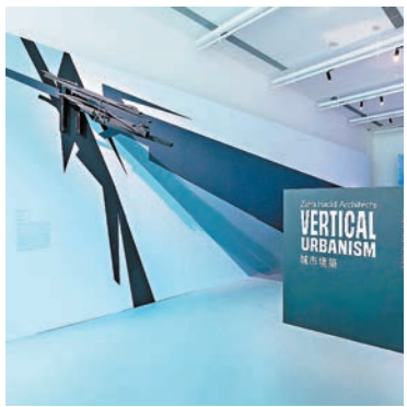
◆「Zaha Hadid Architects：城市境築」將展示Zaha Hadid Architects (ZHA)多元廣泛的建築設計方案。