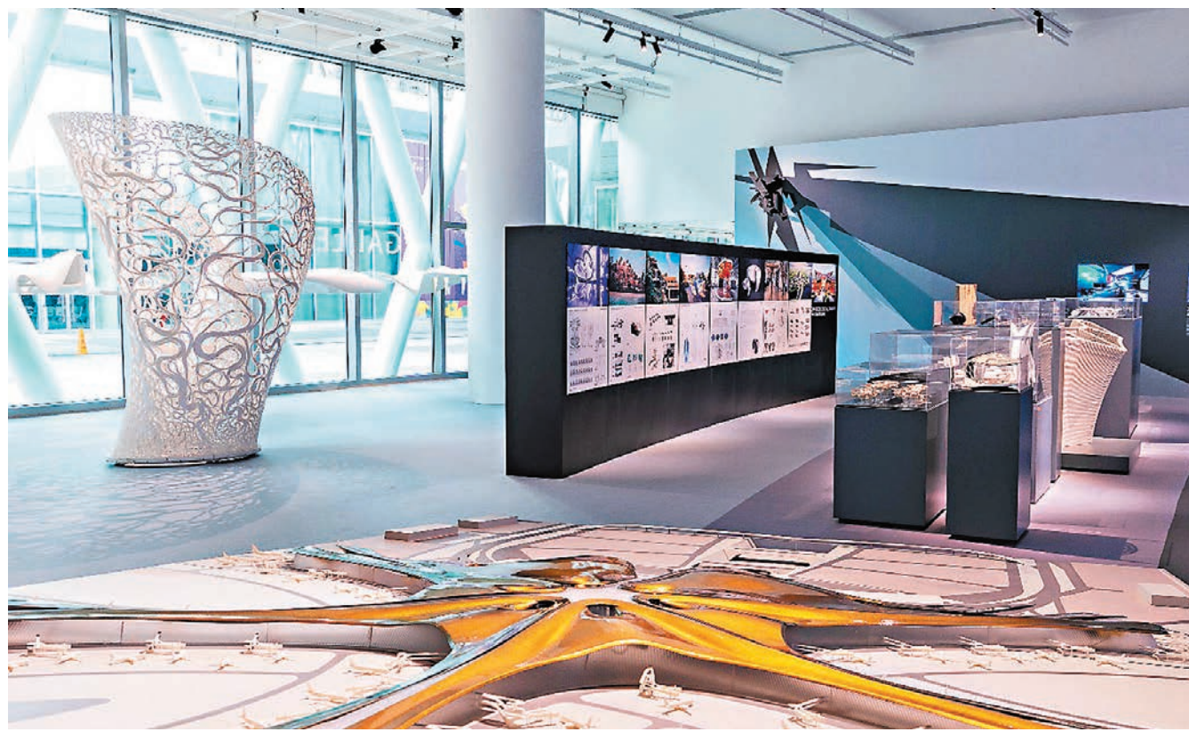
◆展覽運用建築繪圖及圖解、電腦成像、建築模型、錄像投影和虛擬實境體驗裝置等展品，呈現ZHA破格創新的建築思維。