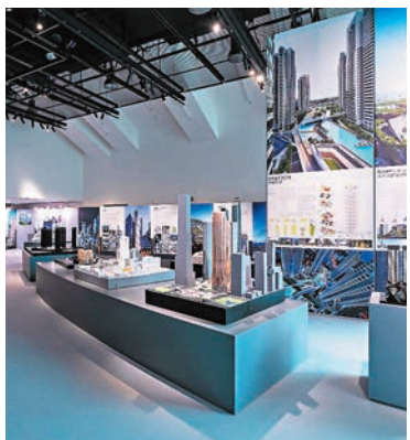
◆是次展覽將精選ZHA於世界各地的高樓大廈項目，演繹二十一世紀都市主義的創新概念。