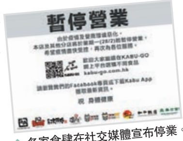
◆多家食肆在社交媒體宣布停業。