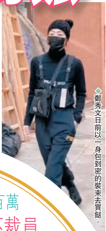
◆鄭秀文日前以一身包到密的裝束去買餸。