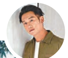
◆吳浩康自言已定性。

香港文匯報訊(記者文芬)38歲歌手吳浩康(Deep)入行以來感情生活豐富，與胡定欣、莊思敏、鍾舒漫等女星都曾經扯上關係。近日更傳出雙喜臨門，跟曾參選港姐的35歲郭思琳奉子成婚。Deep親自開腔承認雙喜臨門：「我好開心和大家分享呢個喜訊，我要結婚了！我遇到一個理想的一半，所以我們決定一齊行埋我們的人生。」他續