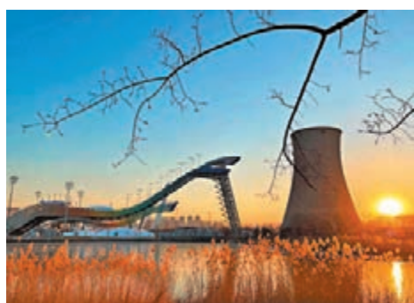
未來的大跳台將充分發揮綜合價值。