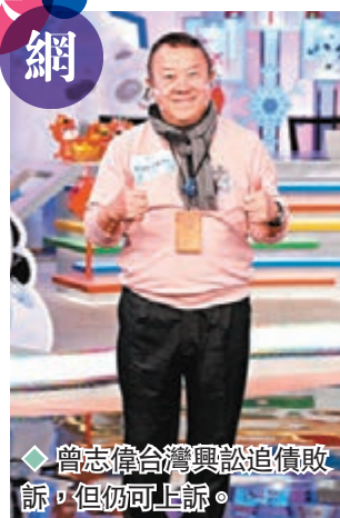
◆曾志偉與台灣藝人合影,但仍可上訴。

香港文匯報訊 據中央社報導,曾志偉提出已故製片裴祥泉生前與他協議投資拍片及借款,欠他新台幣5,700萬元(約1,576萬港元),跨海提告裴胞妹胞弟還錢。台北地方法院審理後,認為雖然曾志偉提出借據,但僅能證明裴祥泉有在借據上簽名,但未提出任何約定酬勞、借款契約的書面文件。法院向移民署查閱入境資料,發現志偉在2份借據簽立之時並未在臺灣,判決志偉敗訴。全案可上訴。