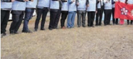
▲廣總首長異口同聲強調，勳力同心，同向發力，必能早日戰勝疫情！