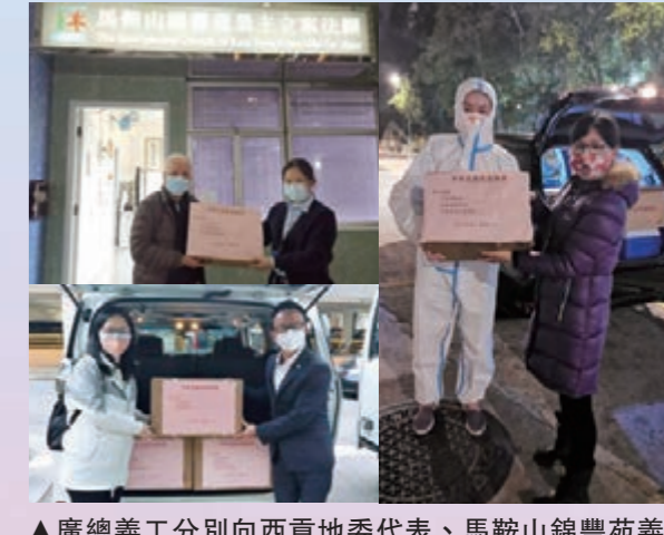
▲廣總義工分別向西貢地委代表、馬鞍山錦豐苑義工及博康郵義工贈送金花清感顆粒。