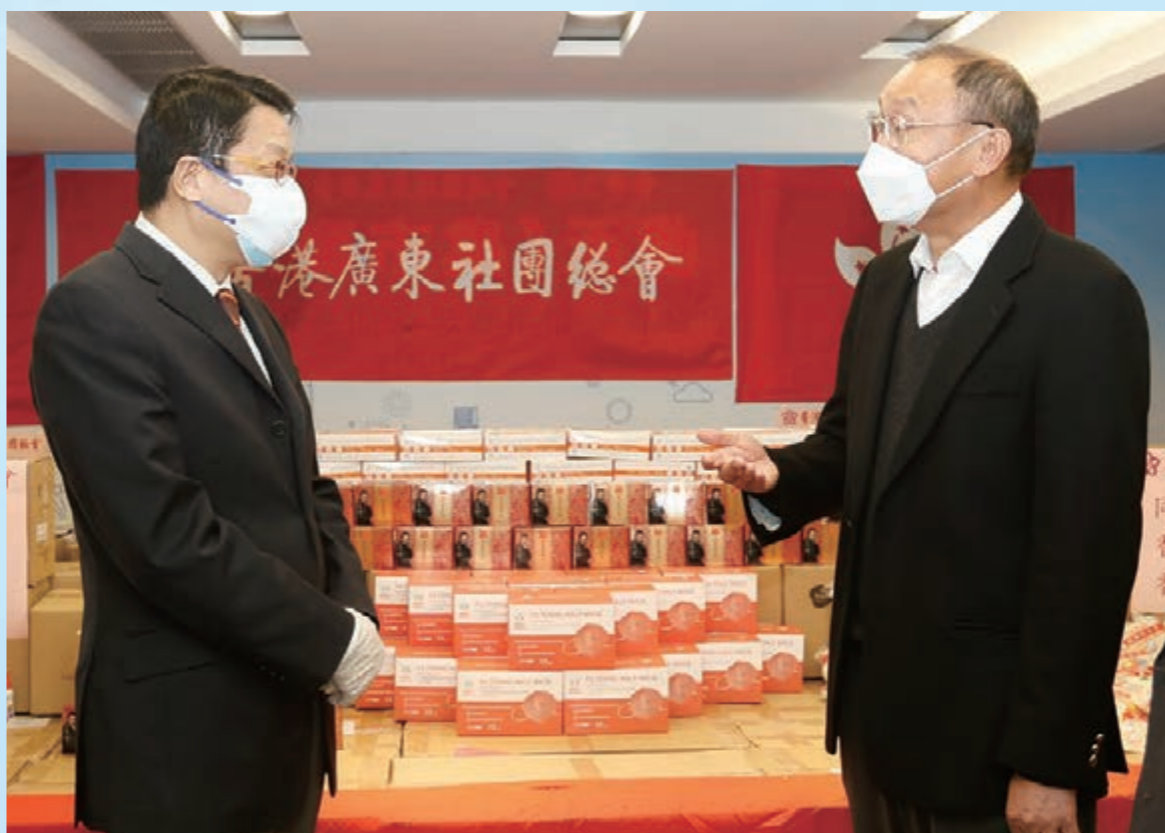
▲民政事務局長陳積志(左)與香港廣東社團總會第一執行主席鄧清河出席捐贈儀式。

社團、18區地委、NGO機構、院舍、警方、部分旅遊業司機、部分小商販、廣東省21地級市社團、前線義工、確診鄉親和市民、受影響屋苑管理處等，急民之所急，助全民防疫。