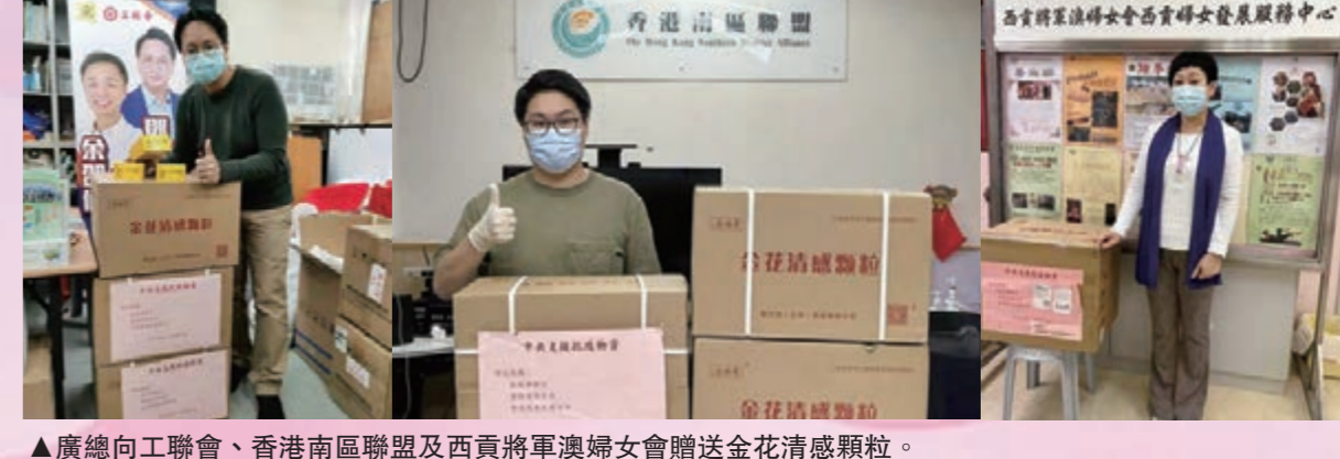
▲廣總向工會、香港南區聯盟及西貢將軍澳婦女會贈送金花清感顆粒。