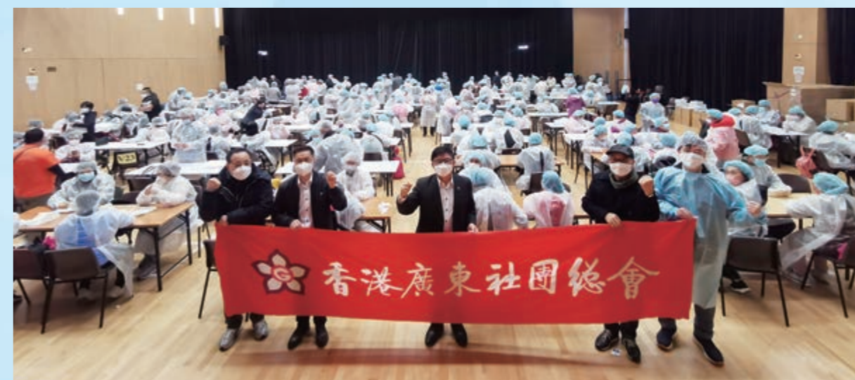
▲1月31日至2月4日，應香港民政事務局長邀請，廣總在全港18區協助包裝快速檢測套裝，派出2300義工，協助包裝快速檢測盒54萬份。廣總首長與義工們一起在各區社區會堂渡過了一個「別開生面」的春節。

區區委員以及屯門區抗疫情連線捐贈抗區區物資。香港廣東社團總會向新社區屯門區區區委員以及屯門區抗疫情連線捐贈抗區區物資。