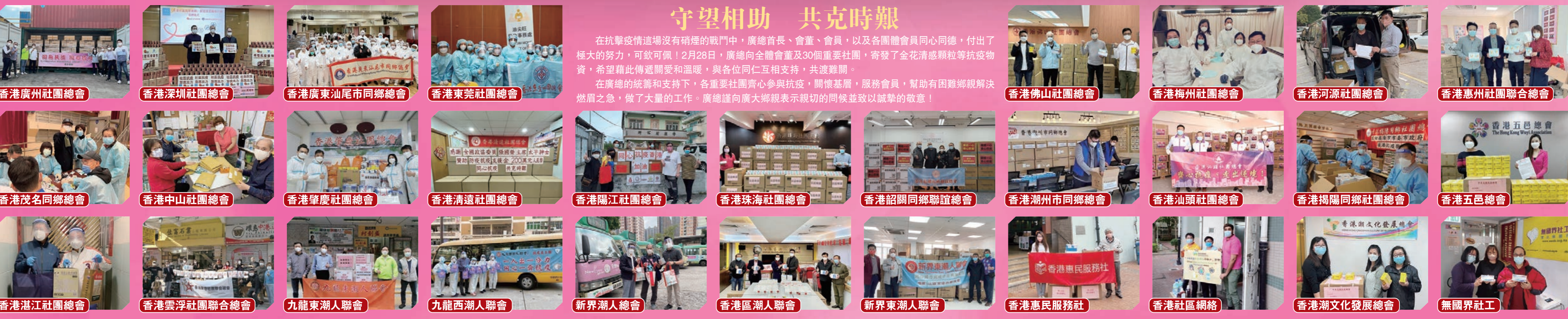
香港廣州社團總會 香港深圳社團總會 香港廣東汕尾市同鄉總會 香港東莞社團總會 香港佛山社團總會 香港梅州社團總會 香港河源社團總會 香港惠州社團聯合總會 香港茂名同鄉總會 香港中山社團總會 香港肇慶社團總會 香港清遠社團總會 香港陽江社團總會 香港珠海社團總會 香港韶關同鄉聯誼總會 香港潮州市同鄉總會 香港汕頭社團總會 香港揭陽同鄉社團總會 香港五邑總會 香港江社團總會 香港雲浮社團聯合總會 九龍東潮人聯會 九龍西潮人聯會 新界潮人總會 香港區潮人聯會 新界東潮人聯會 香港惠民服務社 香港社區網絡 香港潮文化發展總會 無國界社工