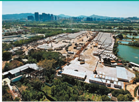
◆元朗潭尾方艙醫院