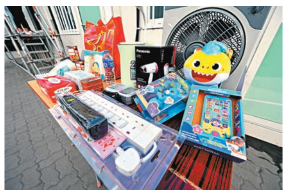
◆青衣方艙物資供應充足。