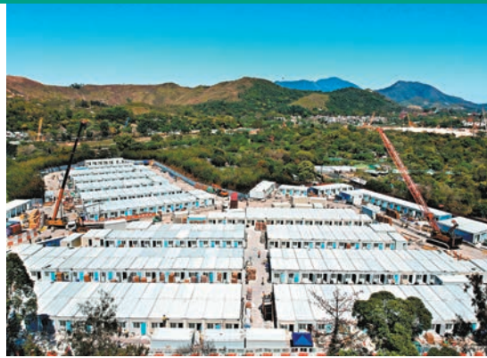
◆粉嶺方艙醫院

他也已行使《緊急情況（豁免法定規定）（2019冠狀病毒病）規例》下的授權，就援建工程及有關人員及物資，豁免其受香港特區相關法律的限制。