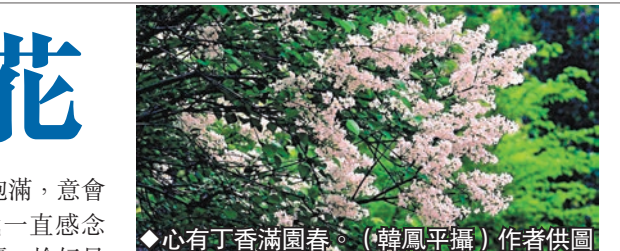
◆心有丁香滿園春。

薰風裏，垂柳輕搖着纖纖柔柔的情影，漂洗了靈靈秀秀的眸子。丁香花恰似一顆柔弱的心靈，不由得讓你去憐惜、心疼。那玲瓏挺脫的紫色婀娜，每一瓣都有着自己的音韻，彈撥和弦，傾吐憂愁。風吹過，散落無數細碎殘花，如同淡紫色的夢輕輕落地。