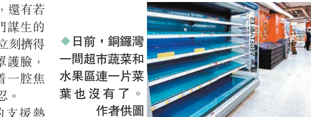
◆日前，銅鑼灣一間超市蔬菜和水果區連一片菜葉也沒有。