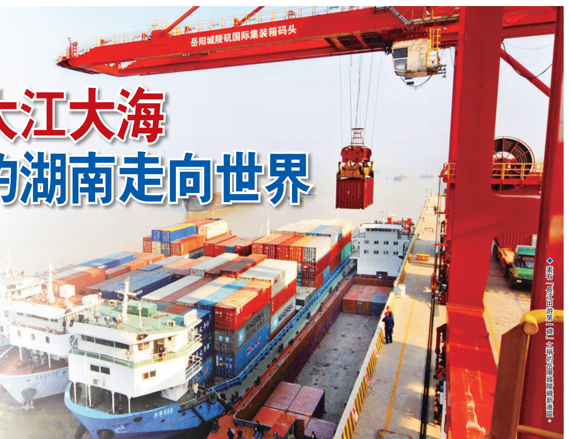
素有「長江中游第一磯」之稱的岳陽城陵磯新港區。

2021年，湖南進出口總額首次逼近6000億元關口，自2017年以來年均增長25%左右，2021年增速居全國第一。跨越大江大海，開放的湖南正在大步走向世界。 文：傅春桂