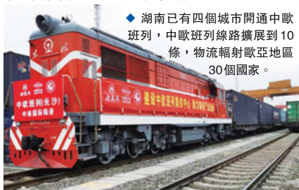
◆湖南已有四個城市開通中歐班列，中歐班列線路擴展到10條，物流輻射歐亞地區30個國家。

「十三五」期間，湖南組織舉辦了阿斯塔納博覽會中國館湖南活動周、中國(湖南)歐洲貿易投資洽談會、中國國際軌道交通和裝備製造業博覽會、北京世園會湖南日活動、湖南國際綠色發展博覽會、湖南國際通用航空產業博覽會等21場重大國際性會議展覽，組織企業參與境內外展覽320餘場次，促成228個項目成功簽約，合同引進資金938.6億元；累計接待來訪團180批次，組織出訪團組35個，帶領3000餘家湖南企業走出國門，邀請和接待了國外1000多家企業來湘參會或考察，湖南對外「朋友圈」進一步擴大。