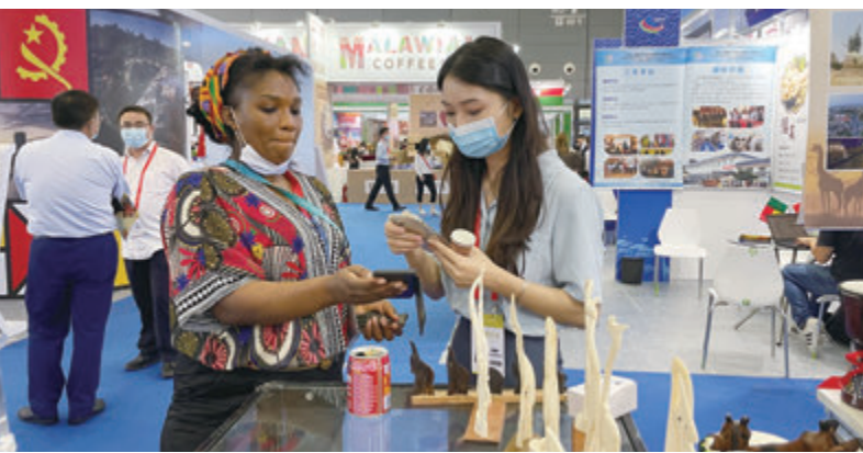
◆長沙市民在家門口就能方便地消費來自全球各地的特產。

近年來，湖南外向型經濟來勢正猛，進出口總額2018年突破3000億元，2019年突破4000億元，2020年接近5000億元，2021年接近6000億元，年均增長率達25.2%，居全國第一位。