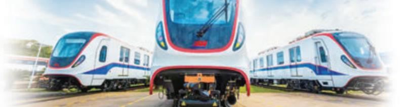
◆中車株機研製的輕軌列車出口到墨西哥蒙特雷。

數據顯示，2021年湖南全省對外投資實際投資額16.7億美元，同比增長12.1%，位居全國第10，中部第1。