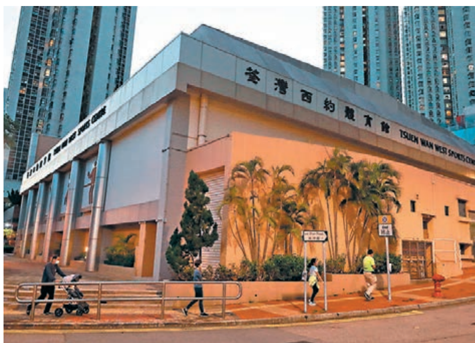
◆7間體育館將改建成暫託中心，提供逾千張床位。圖為荃灣西約體育館。

第五波疫情下，安老院舍爆疫連連，安排輕症及病情穩定的長者入住社區暫託中心迫在眉睫。除已投入服務的兩間中心外，有消息指出灣仔、天水圍及屯門等7間體育館亦將建成長者暫託中心，預計可額外提供合共逾千張床，其中灣仔港灣道體育館及天水圍體育館的暫託中心料日內投入服務。連同已投入服務，及將於本月中下旬起分階段啟用的啟德郵輪碼頭，已知的暫託中心合共可提供逾2,500張床（見表）。香港特區行政長官林鄭月娥日前已要求私家醫院承辦更多中心，養和醫療集團昨日回覆香港文匯報查詢時表示，將承擔設於小西灣體育館的暫託中心服務，現正積極招募人手，包括退休員工及以往曾在醫院實習的護士學生，預計涉及約160張床。