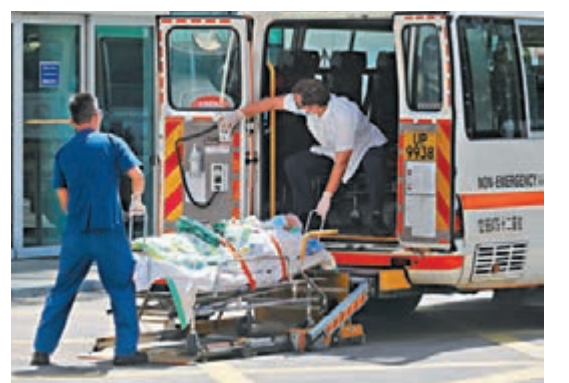
◆伊利沙伯醫院非新冠病人有序撤離，送往其他公立醫院，全院將轉換成專治新冠肺炎定點醫院。

她又表示，醫院亦已規劃新冠病人出入醫院路線，及增加通風設備，和為員工提供適合的防護