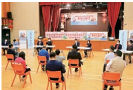
◆「全港社區抗老連線」昨舉行「安老院舍抗疫物資支援計劃集中行動日」。

通，聯手具實質的醫療機構，盡快為符合條件的長者提供接種疫苗的服務，築起免疫長城；其三，更加關注和推動改善長者醫療救助條件，與政府部門、醫療機構加強溝通協調，開闢生命通道，讓不幸染疫長者及時得到支援和救治，感受到中央關愛和社會溫暖。