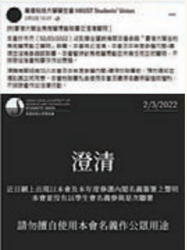
◆科大學生會澄清沒有參與聯署。網上截圖

事實上，以不同學生團體聯署的方式鼓動大學生參與「抗爭」，在2019年修例風波期間，已是反中亂港分子慣用的伎倆。而聯署中所謂「民族自決」等詞，更是反中亂港分子常掛在嘴邊的「洗腦」詞彙，不排除該聯署有意「喚醒」部分人等的「抗爭」情緒。