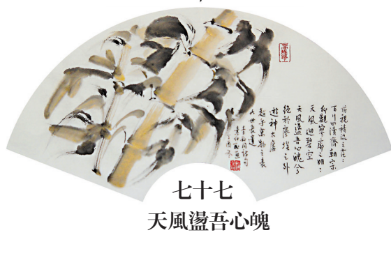
七十七 天風盪吾心魄

天風 俯視積流之茫茫，百川四瀆齊朝宗。仰觀寥廓之明明，天風迴碧空。天風盪吾心魄兮，絕於塵埃之外，遊神太虛。超乎萬物之表，與世長遺。