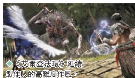
◆《艾爾登法環》延續製作人的高難度作風。

界大作《地平線 西域禁地》，PS 陣營近來可謂搶盡風頭。Xbox 和 Switch 也沒讓對手專美，譽滿全球的《黑暗靈魂》開發團隊 FromSoftware 日前推出《艾爾登法環》這款由《權力遊戲》小說原作者負責編劇的全新「黑魂」系列作 (Xbox 及 PS 同步上市)，難度和製作人過往的《黑暗靈魂》系列、《隻狼》和