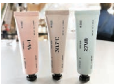
◆FACTIVE x ONE DAY 香氣潤手霜

亦分為輕盈及豐厚兩款質地，適合不同膚質的用戶。另外，Crystal Mask 粉紅水晶抗菌潤手霜，集合修護、滋潤及抗菌三大功能於一身，含有粉紅水晶及多種高效精華，做到「先急救、後補濕、再鎖水」的潤膚效果。它利用 BKC 抗菌因子技術，不含酒精卻具備同等消毒殺菌功效，20 秒殺死 99.9% 細菌，通過歐盟標準 EN1276 抗菌認證，並獲新加坡國家環境局證實有效抗疫。大家薄薄塗上一層，就可以帶來長達 3 小時的防菌保護，能夠有效抑制病毒及細菌生長。