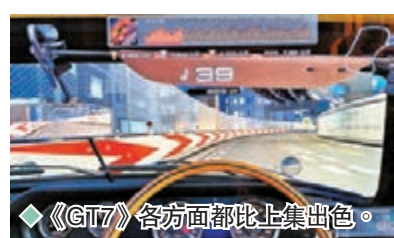
◆《GT7》各方面都比上集出色。

踏入誕生 25 周年的 PlayStation 專屬賽車遊戲《跑車浪漫旅》(Gran Turismo, 簡稱 GT)，日前在 PS5 和 PS4 兩代主機推出全新系列《GT7》，受惠於新機的强大運算能力與 SSD 高速讀碟，過往難以實現的閃電式讀入遊戲與 4K 60fps HDR 超高畫素畫面終能透過 PS5 版完全呈現玩家眼前。更重要的是新機手掣 DualSense 的觸覺回饋及自適應扳機功能，把跑車在賽道中的微細動態如路面凹凸情況充分反映給玩家去感受，這是過往各集《GT》都無法比擬，為本系列揭開全新一頁。連同上月開放世