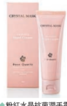
◆粉紅水晶抗菌潤手霜