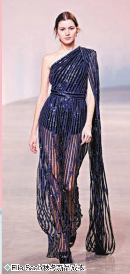
◆Elie Saab 秋冬新品成衣