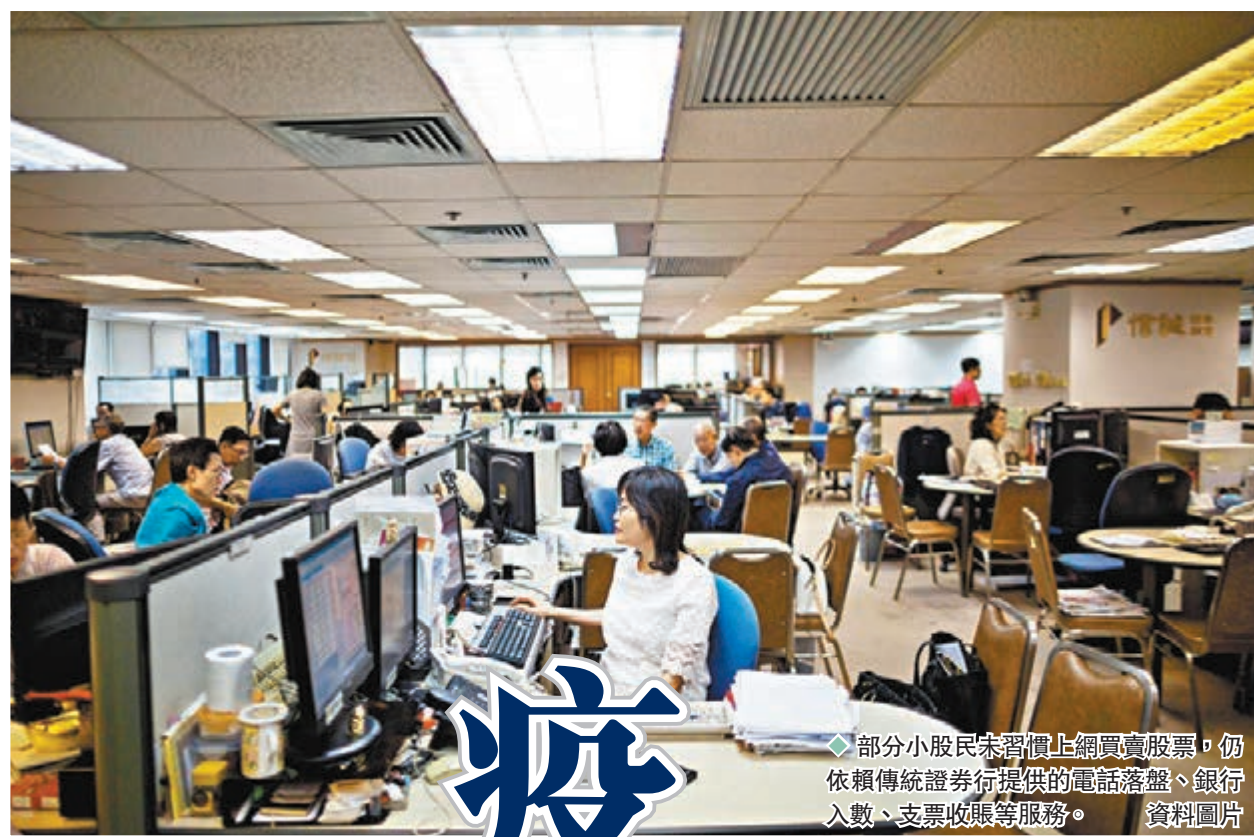
◆部分小股民未習慣上網買賣股票，仍依賴傳統證券行提供的電話落盤、銀行入數、支票收賬等服務。資料圖片