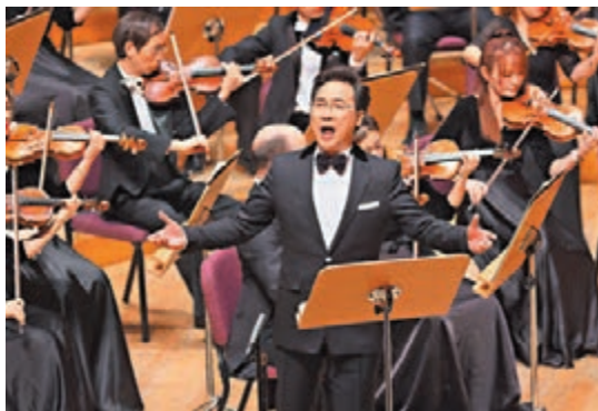
◆廖昌永曾在第37屆上海之春國際音樂節中領唱歌曲《理想照耀中國》。新華社