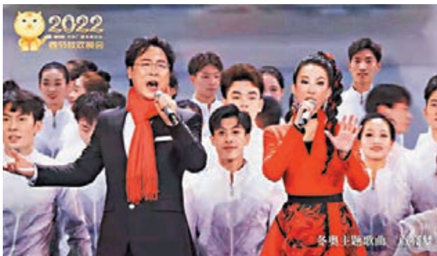
◆廖昌永曾與李玟合作唱響冬奧主題歌曲《點亮夢》。資料圖片

德樹人根本任務。廖昌永表示，藝術家追求的目標是德藝雙馨，只有精湛技藝還不夠，美學修養、綜合素養也很重要。