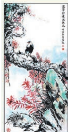
◆梁君度畫作《寂寥紅葉點秋光》。