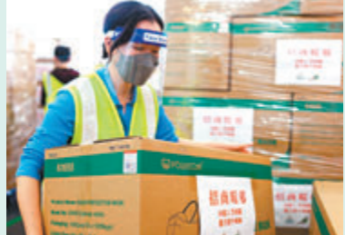
申雅思緊急處理需要派送到香港各公屋的防疫物資。