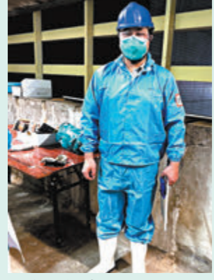
余紀胡凌晨開始開肚取豬工作，只為新鮮豬肉能如常供應。