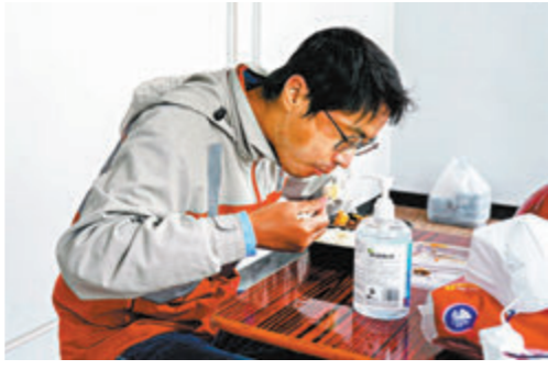
李易峰在工作間隙匆匆解決午餐，面上同樣有太陽曬過的口罩印。