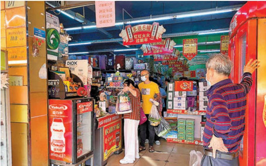
◆東莞的超市未出現物資短缺。

香港文匯報訊（記者 帥誠 廣州報道）因新冠疫情影響，3月14日東莞市公交、地鐵暫時停運，東莞全市小區、村（社區）一律實行圍合管理，工廠企業、產業園區全面實行封閉式管理。有在東莞生活的港人表示，雖然公共交通停運給出行帶來不便，但目前超市物資充足未影響到基本生活，有台商稱目前工廠員工進出需24小時核酸陰性證明，政府設有多個免費檢測點便利廠區員工。