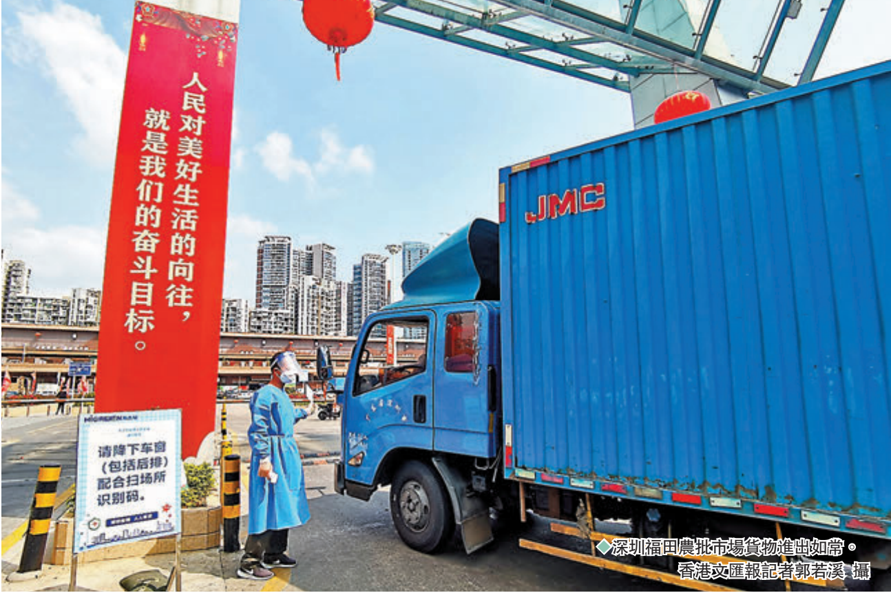
◆深圳福田農批市場貨物進出如常。