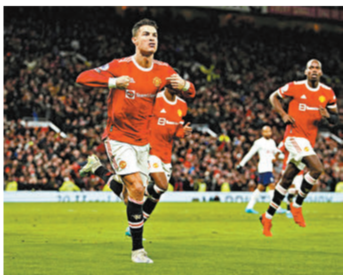
C朗拿度(左)上仗連中三元,助曼聯以3:2擊敗熱刺。

在荷甲領跑的阿積士,在首回合戰和2:2後是役再撼葡超排第3的賓菲加,在表現神勇的施巴斯坦賀拿領銜鋒線下,阿積士力爭各項賽事主場8連勝,晉級8強。(now644台周三4:00a.m.直播)