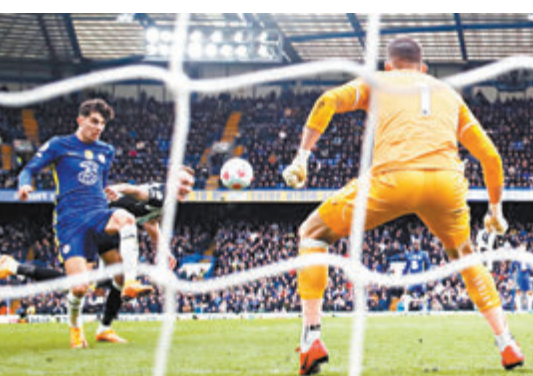
夏維斯(左)於完場前1分鐘為「車仔」射入奠勝一球。

香港文匯報訊(記者 梁志達)英超當地時間13日兩場焦點較量,車路士以一場絕殺來送給剛遭英國政府制裁的「油王」班主艾巴莫域治;阿仙奴則豪取聯賽5連勝,穩守積分榜第4位。