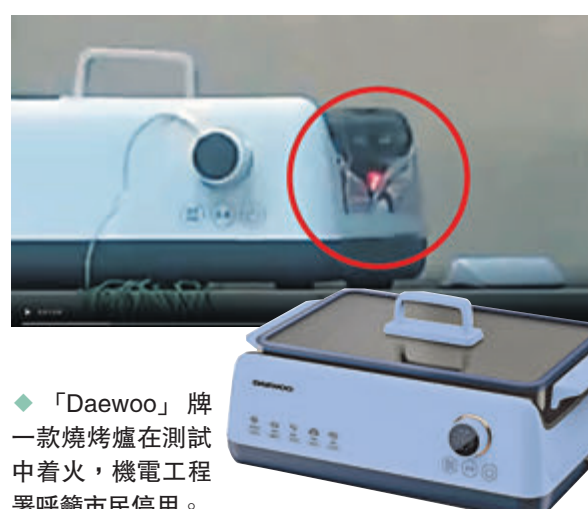
◆「Daewoo」牌一款燒烤爐在測試中着火，機電工程署呼籲市民停用。

消委會提醒市民，燒烤時避免用金屬器具，應用木製或矽膠製器具，以免刮花烤盤的防黏塗層。機電署呼籲市民停用大字牌SG2717C型號的藍色電烤爐，該署指該款爐在消委會測試中有機會構成火警危險，供應商決定回收，受影響批次在去年6月至9月發售，市民如已購買有關批次的電烤爐，可致電熱線37934069，以安排更換。