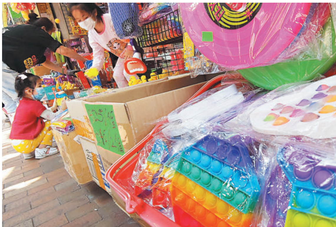
◆消委會測試市面29款塑膠玩具，發現不少樣本含潛在致癌物多環芳烴。