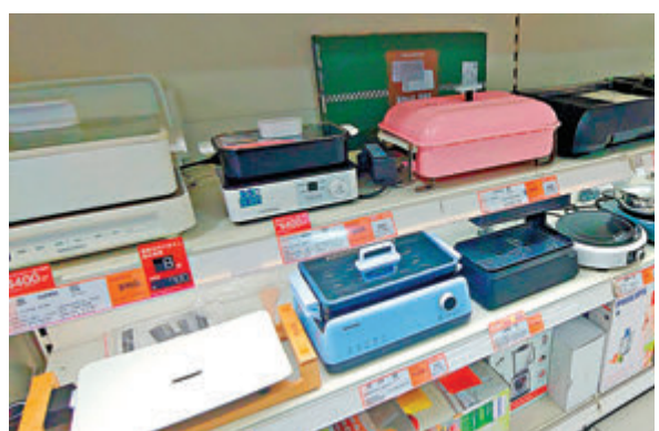
◆有專頁稱低價出售烤爐，事主付款後，專頁卻突然消失。消委會呼籲市民選擇商譽良好的商戶。

消委會提醒市民，疫情下應保持良好的購物心態，切勿衝動消費，要提高警覺、保持理性，需了解清楚產品質素、銷售條款及一旦需要退款或退貨時的安排，並應揀選較穩健及具口碑的網購平台消費。