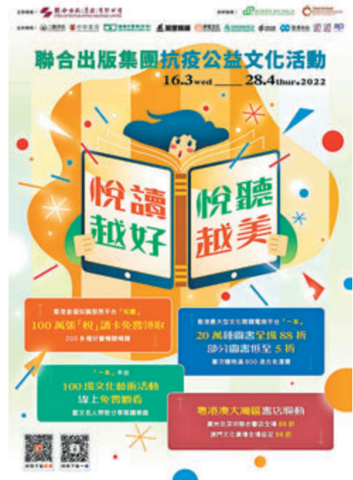
◆聯合出版集團啟動公益計劃，多間書店一同參與。

香港文匯報訊（記者 鍾健文）為幫助廣大市民在居家抗疫期間以閱讀療癒身心，及莘莘學子在提早暑假中自主學習和成長，聯合出版集團今日起至4月28日，啟動「悅讀越好 悅聽越美」抗疫公益計劃，讓全港市民免費閱讀逾200種精品電子書和有聲書，並有20萬種精品圖書八折優惠，以及100場藝文節目免費線上觀看，集團設在粵港澳大灣區的多間書店一同參與。