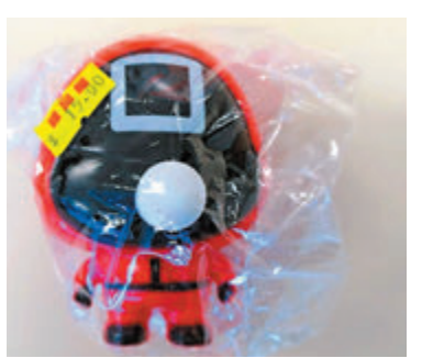
◆部分不安全的塑膠玩具。

香港文匯報訊（記者 文森）疫情肆虐下，兒童減少外出遊玩，玩具是他們留家抗疫期間的最佳玩伴，但消委會測試市面29款塑膠玩具，包括近年盛行的經壓膠玩具和擠壓玩具，結果發現超過八成半樣本的物料檢出潛在致癌物多環芳烴（PAH），當中一款圓形鯊魚遊戲Squeeze Toy同時驗出可致癌塑化劑DEHP，超出香港法例上限250倍，可損害男性生殖系統和影響胎兒發育。海關巡查亦發現，4款兒童玩具具有安全隱患，呼籲家長立即停止讓兒童把玩有關玩具，商戶如有出售，亦應立即下架。