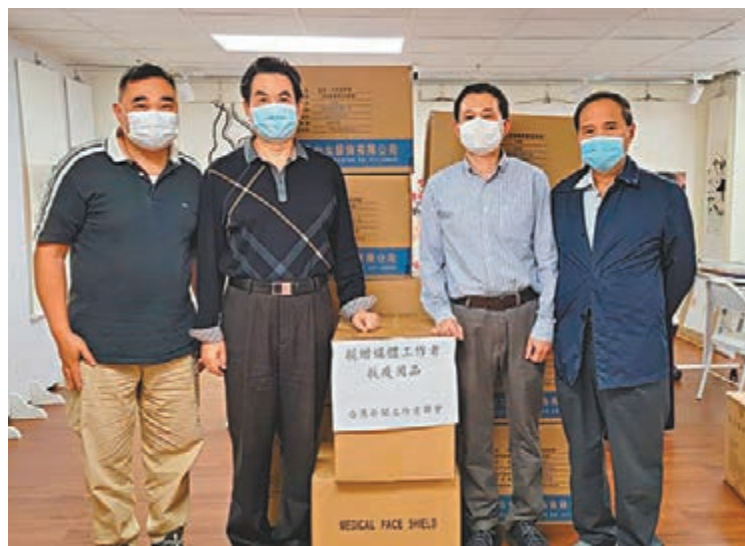
◆新聞聯向星島日報捐贈抗疫物品。