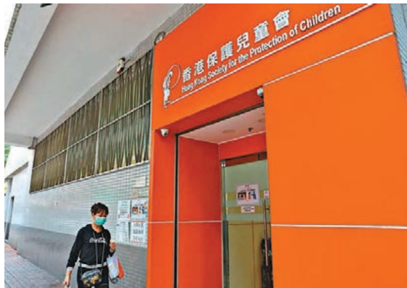
◆「童樂居」虐兒案，警方至今累計拘捕32人，40名嬰幼兒疑受虐。資料圖片

消息指，警方已完成翻看逾六萬小時長的「童樂居」院舍內閉路電視影片，至今共拘捕32人。而據當時調查的院舍更表顯示，「童樂居」當時接觸照顧幼兒的職員約有40人，其中大多數職員已被捕，而警方不排除將會再有拘捕行動。事件中，共有40名嬰幼兒疑受虐。