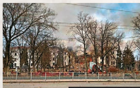
▲馬里烏波爾一間劇院局部坍塌。