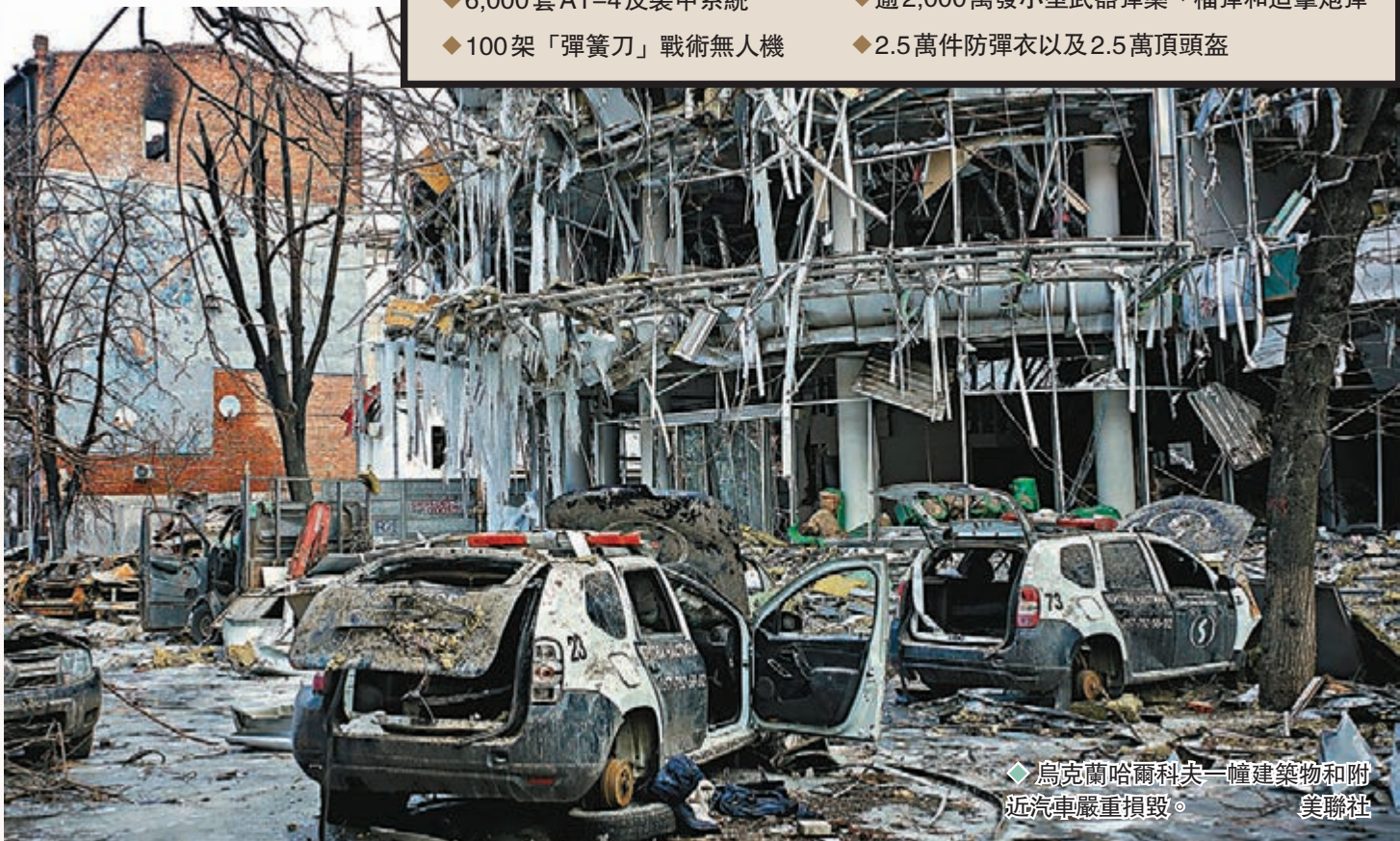
◆烏克蘭哈爾科夫一幢建築物和附近汽車嚴重損毀。