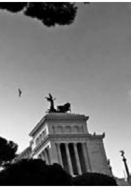
◆條條大路之外，清晰長天亦通羅馬。

八百多年荷南古城Maastricht馬城條約的馬城中心，擁有Flemish風格堅實幽深廣闊教堂多座，教人目不暇給。一步一步；比利時法語區布魯塞爾的教堂跟荷語區完全是另外一種誇耀風格，但跟再南下2個小時的巴黎相比，Olala即變鄉鎮！ 從荷蘭及比利時南下，自城北入巴黎，未至偌大古董市場Clignancourt，老遠望到體態宏偉位於蒙馬特山白色聖心教堂(老派巴黎人眼中，只是一座吸引遊客的俗艷建築物)，真正的藝術巨著是你放棄巴黎鐵塔，錯過參觀等同罪過的巴黎聖母院(需時半天吧，單單表