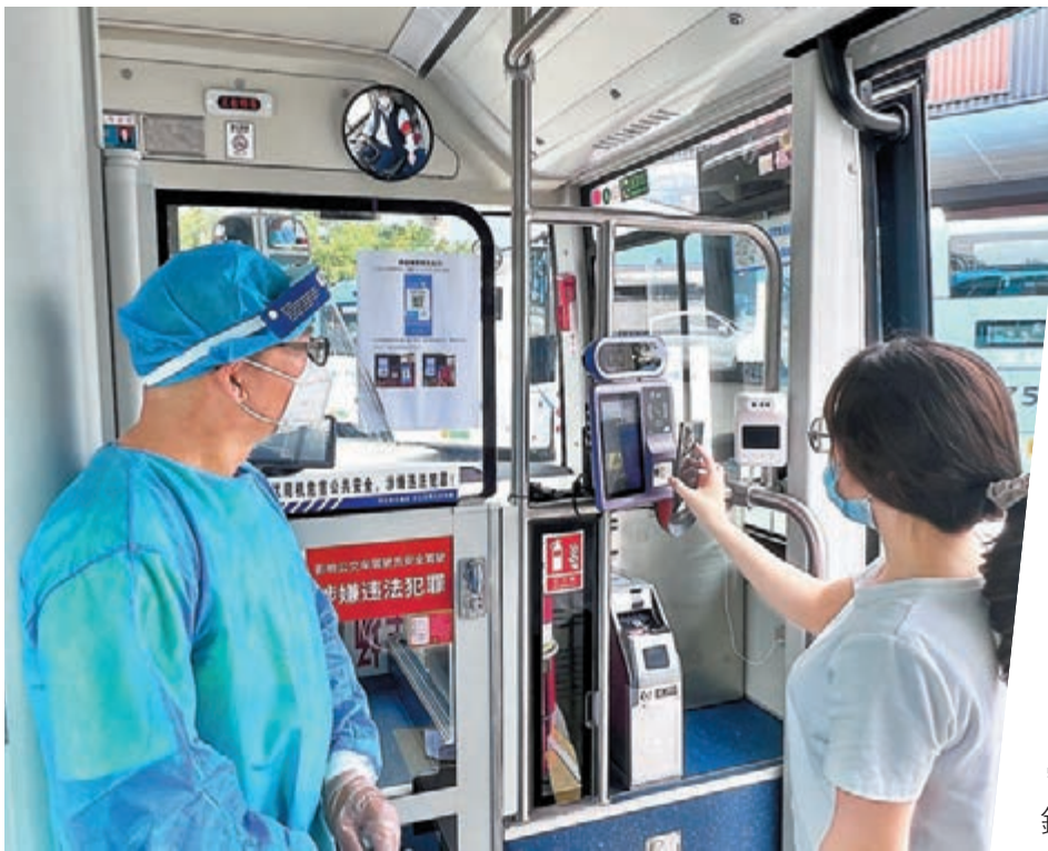
◆乘客上車要使用移動電子哨兵查驗身份及健康信息。香港文匯報記者郭若溪攝