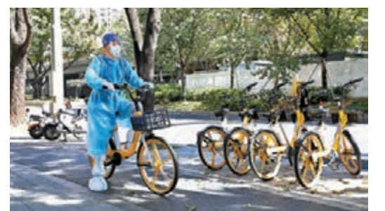
◆防疫人員騎共享單車出行。