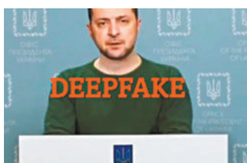
◆網傳「勸降」片被發現是造假。

俄烏衝突出現的信息戰中，也有近年興起的「Deepfake」（深度偽造）技術蹤跡，網上近日流傳一段烏克蘭總統澤連斯基勸告烏國民眾「投降」的影片，便相信是利用該技術合成。網絡專家指出，網上充斥這些以假亂真的影片，民眾需留意各方資訊，細心加以辨別。