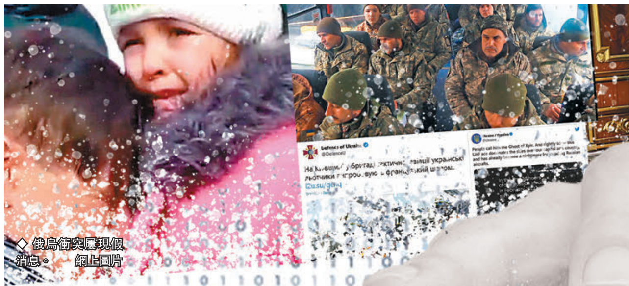
◆俄烏衝突屢現假消息。網上圖片

俄羅斯與烏克蘭的軍事衝突持續，在正面戰場幕後的「信息戰」也愈演愈烈。這些真偽難辨又互相矛盾的信息背後，正是互聯網時代國家之間的全新博弈方式。網絡安全專家指出，現代信息戰專業性極強，操縱得當便可充分調動民眾情緒甚至操控輿論，增加影響力左右戰局，屬於「看不見的戰場」。身處其中的民眾需要綜合了解多方資訊、客觀分辨不同敘述，從而對時局擁有理性的認知。