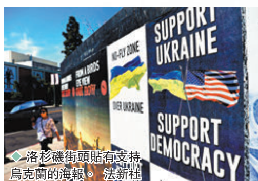
◆洛杉磯街頭貼有支持烏克蘭的海報。

烏俄衝突期間，社交媒體上曾湧現大量關於烏國士兵抗俄的故事，部分更是烏克蘭政府親自宣揚，吸引大批網民轉載。然而相關影片和照片陸續被發現造假，惹來網民批評。信息戰專家認為，烏方為了在輿論上奪取優勢，明顯利用未經證實資訊甚至偽造資訊，在社交媒體營造「挺烏」氛圍，試圖提振國內士氣，並在國外爭取輿論支持。