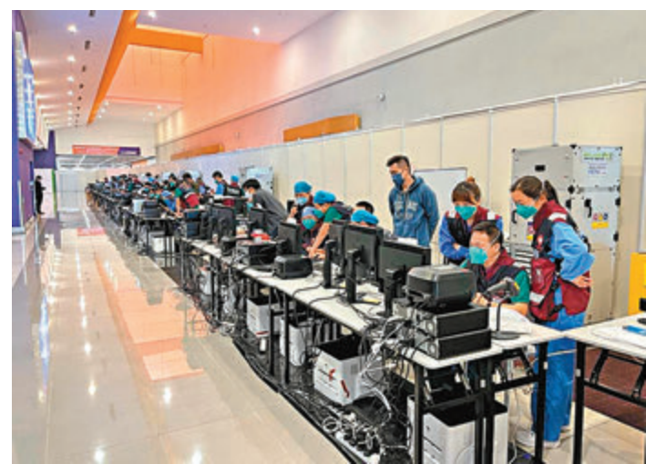
◆醫管局在電腦系統加入中文界面和中文輸入法，而內地醫生也主動以英文輸入病歷紀錄。