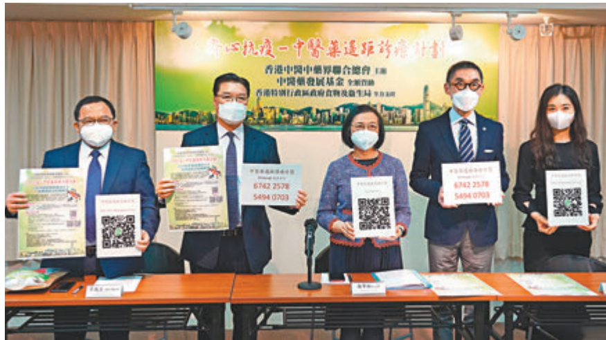
◆由港區全國人大代表暨香港中醫藥聯合總會統籌，近200位中醫藥師推行「中醫藥遙距診療計劃」。

香港文匯報訊（記者 子京）目前不少新冠確診者需要在家隔離檢疫，香港中醫藥聯合總會推出「齊心抗疫——中醫藥遙距診療計劃」，免費為居家確診者提供遙距診症及配送藥物服務。由今日起，於每日上午8時起，居家確診者可透過網上或手機應用程式登記，每日限額1,000名。計劃首階段為期約兩個月，將提供兩萬個服務名額。