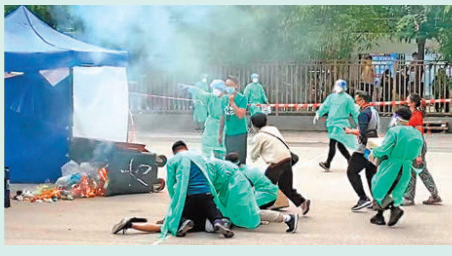
◆ 文匯讀者希望警方加強打擊借疫情企圖搞亂社會的不法分子。圖為早前有不法之徒在檢測站縱火。 資料圖片

目前更為關鍵的，還是需要市民齊心配合，疫情嚴峻，可惜卻仍然有人不遵守防疫規例，或故意發放防疫虛假消息企圖阻擾或分化特區政府防疫防疫工作。這場疫情關乎到每一個人，希望市民和各界能夠按照香港警務處處長蕭澤頤所說的一樣「將心比己、易地而處」，只有這樣才能夠齊心打贏這場「疫戰」。