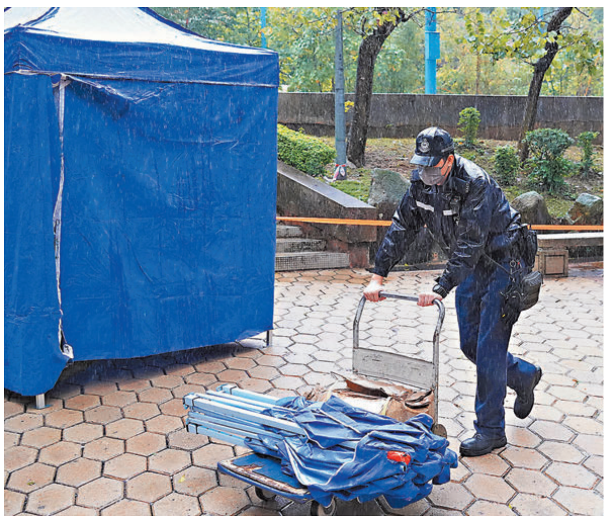
▲ 疫情以來，警隊除維持社會治安外，亦全力參與抗疫。圖為警員冒大雨運送圍封強檢所需物資。 資料圖片

蕭澤頤：未來如果有全民檢測的行動，我們正想着擴大人手。現在每一日的前線同事是進行三班的輪班工作，我們將來可能會變成兩班，從而擴大人手。到時每一個同事每日至少工作12小時或以上。我曾經去過落馬洲河套區，在那裏緊鑼密鼓建設一個臨時醫院和隔離設施，未來這間醫院大概有1,000個床位，相關隔離設施也有大約一萬個。在工地裏建設者們眾志成城，他們24小時工作。很感謝中央的支援，我希望香港都能夠眾志成城、齊心抗疫，一起打贏這一場仗。