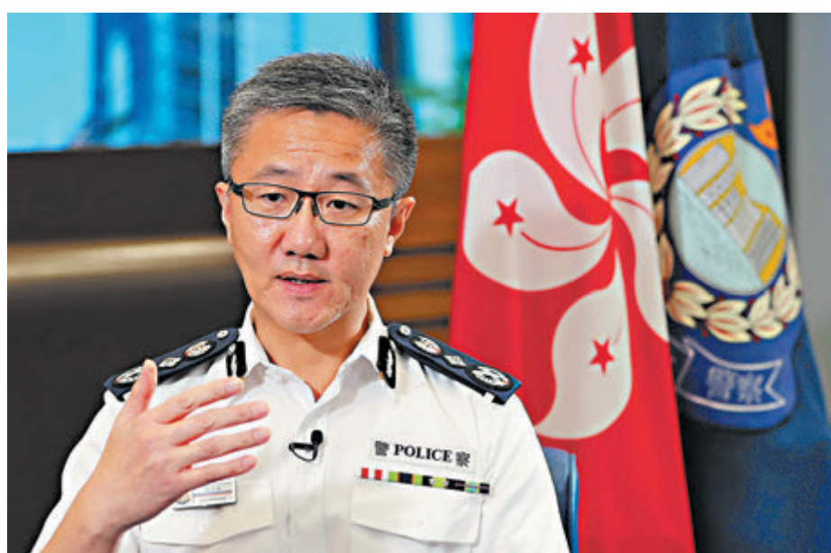
◀ 蕭澤頤呼籲市民和各界「將心比己、易地而處」，齊心抗疫打贏這場「疫戰」。 資料圖片