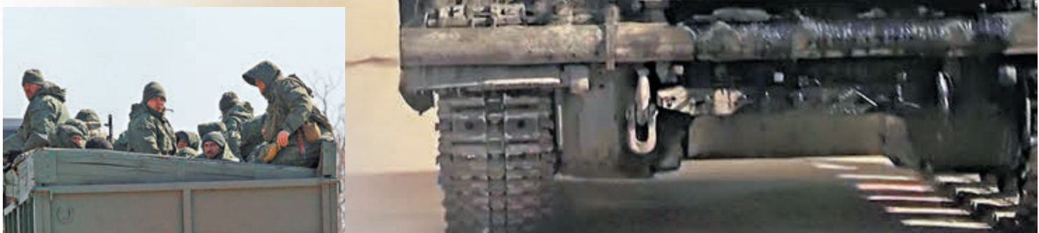
◆3月21日，親俄武裝部隊在馬里烏波爾外圍出現。