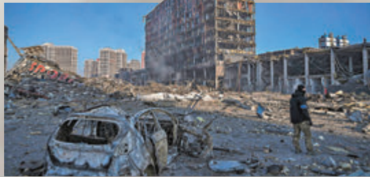
◆烏軍士兵昨日在基輔一座被炸毀的購物中心外巡視。