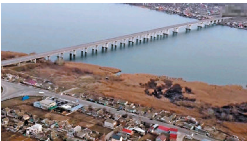
◆俄軍在開戰初期便控制安東諾夫斯基大橋。