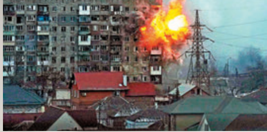
◆3月12日，烏兵守衛馬里烏波爾。