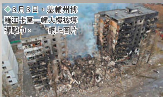
◆3月3日，基輔州博羅江卡區一幢大樓被導彈擊中。