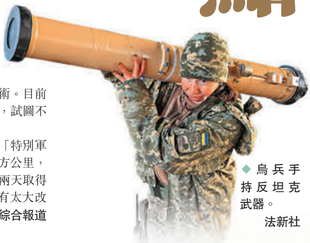
◆烏兵手持反坦克武器。