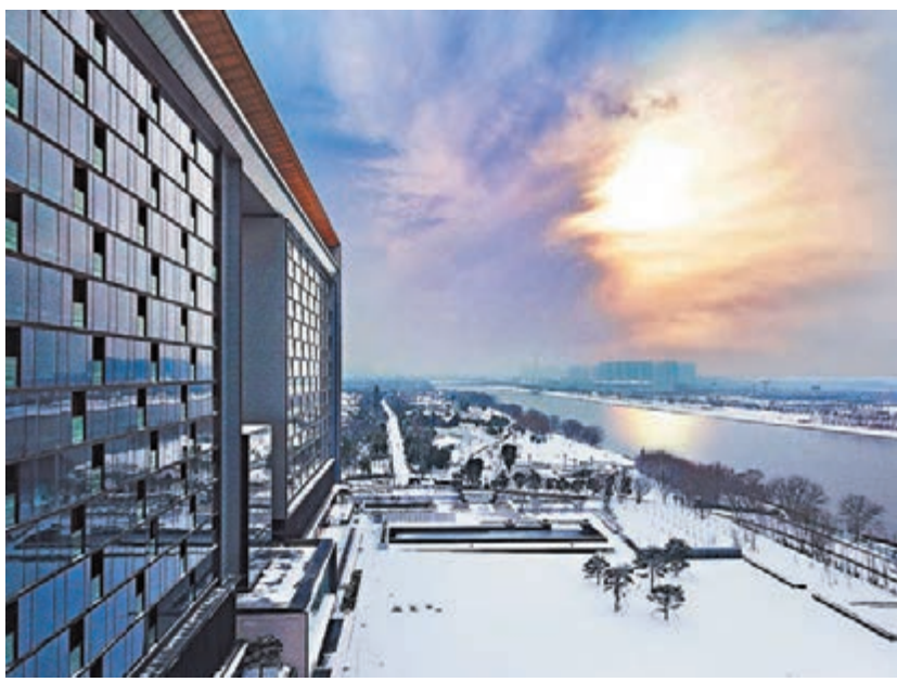
◆南京涵碧樓坐落在長江之畔