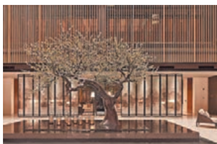
◆在涵碧樓的大堂中央的鑲金梅樹