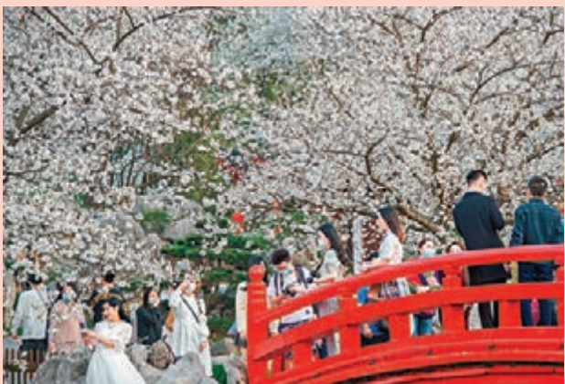
◆遊客在武漢東湖櫻園賞櫻拍照。

柔風漸暖，湖北武漢東湖櫻園的櫻花競相綻放，吸引眾多市民前來遊園觀賞，不少遊客在東湖櫻園賞櫻拍照。同時，在廣西南寧市青秀山風景區櫻花盛開，鋪滿整個風景區，美麗迷人。在上海辰山植物園盛開的櫻花樹下，遊人休閒散步。還有，在湖南省衡陽市常寧市羅橋鎮廟山村櫻花園，人們踏青賞花，樂享春光。