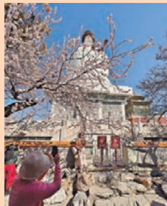
◆遊客在白塔旁拍攝盛開的山桃花。