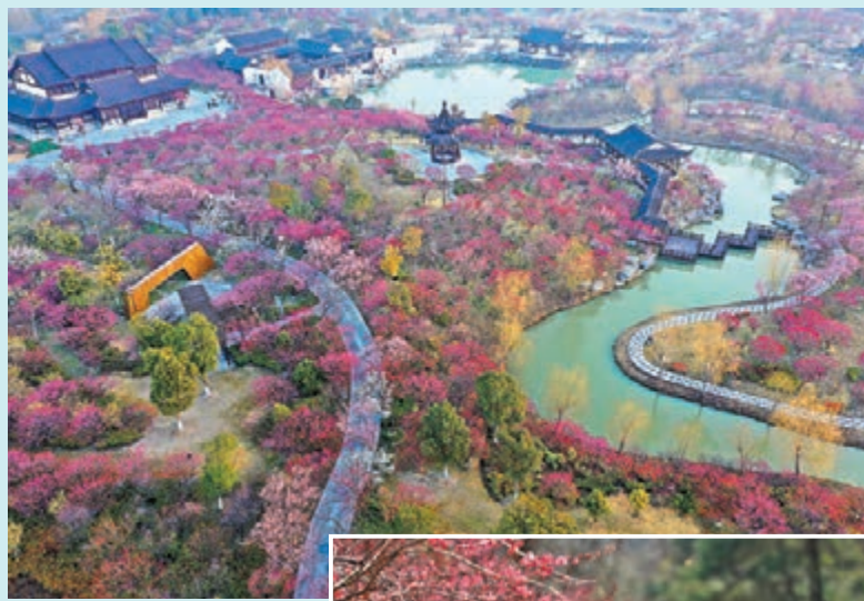
◆在梅花灣景區拍攝的滿園盛放的梅花。

春回大地，萬物復甦，在江蘇省鹽城市大豐區梅花灣景區拍攝的滿園盛放的梅花，而在湖南省張家界黃石寨梅園，遊人正賞花遊玩。