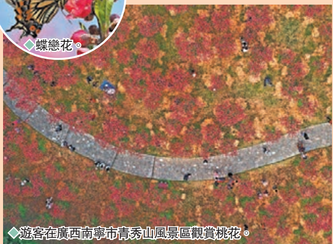
◆遊客在廣西南寧市青秀山風景區觀賞桃花。