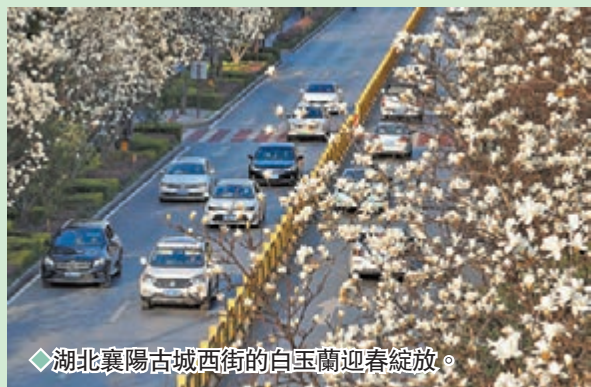
◆湖北襄陽古城西街的白玉蘭迎春綻放。