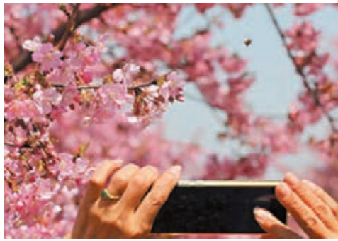
◆遊人在上海辰山植物園用手機拍攝盛開的櫻花。