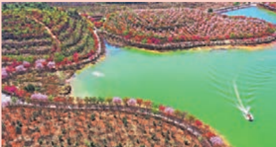
◆羅橋鎮廟山村櫻花園。