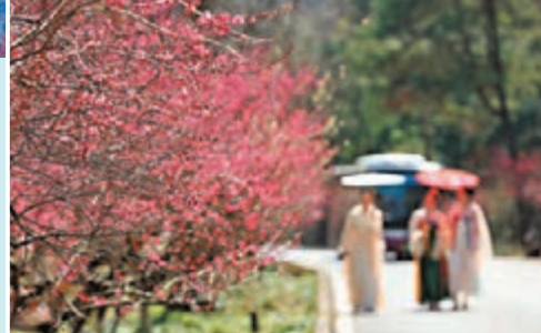
◆遊人在張家界黃石寨梅園遊玩。