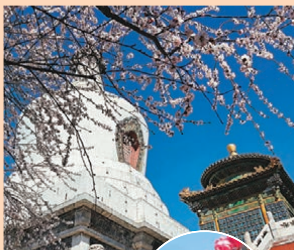
◆盛開的山桃花掩映着北京北海公園白塔。