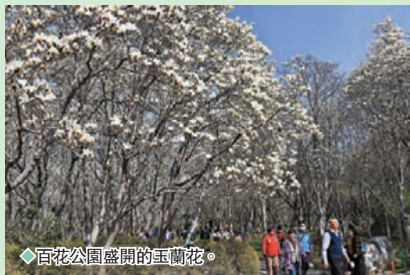
◆百花公園盛開的玉蘭花。