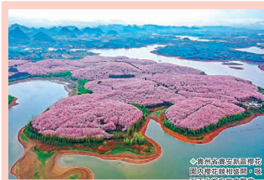
◆貴州省貴安新區櫻花園內櫻花競相盛開，吸引不少遊客前來觀賞。貴安新區櫻花園佔地面積2.4萬餘畝，園內種植近70萬株櫻花。