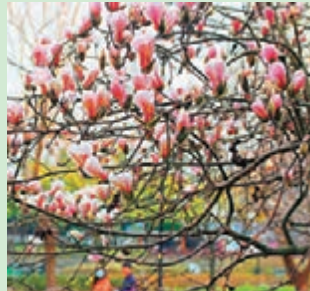
◆在蘇州東園盛開的玉蘭花。

隨着氣溫上升，山東省泉城濟南市區內各處玉蘭花大面積盛開，不少遊客在濟南市百花公園拍攝盛開的玉蘭花。而在長江西陵峽湖北省宜昌市夷陵區樂天溪段江岸，玉蘭花亦競相綻放，美不勝收。