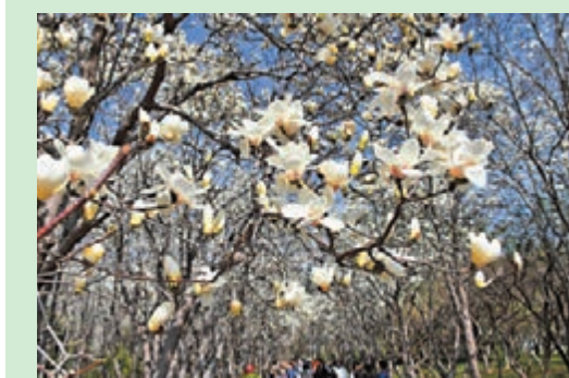
◆山東省濟南市百花公園拍攝的盛開的玉蘭花。