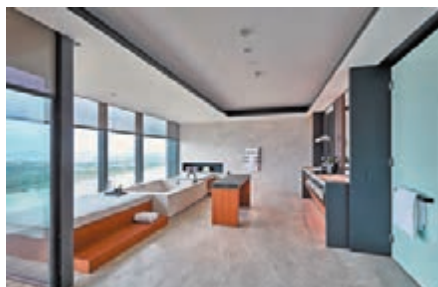
◆臨窗浴缸可隨時觀景