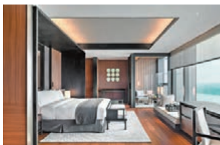
◆南京涵碧樓江景房

另外，節日活動亦帶來喜慶熱烈的氛圍，如在團圓季節下榻南京涵碧樓酒店，有機會參與到冬季限定活動當中，如充滿異國情調的年末聖誕季、民俗年味濃厚的傳統新年體驗季，在此放鬆身心，盡興享受。金陵冬日，南京涵碧樓締造溫暖備至的度假勝地，為每位下榻的旅人創造無與倫比的視覺、聽覺、觸覺、味覺、心覺五感體驗。◆文：雨文