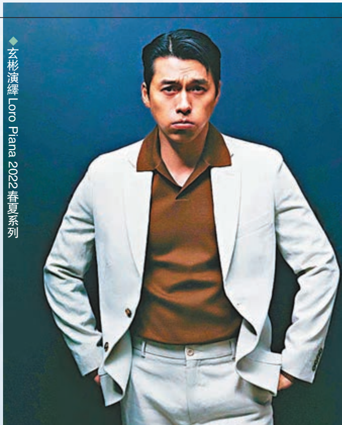
◆玄彬演繹Loro Piana 2022春夏系列