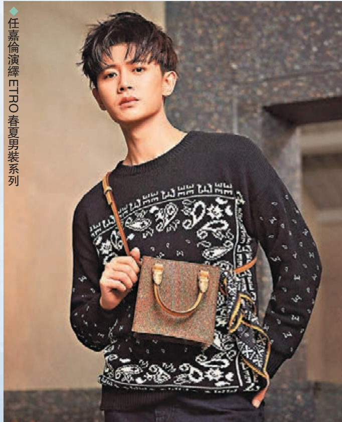
◆任嘉倫演繹ETRO春夏男裝系列