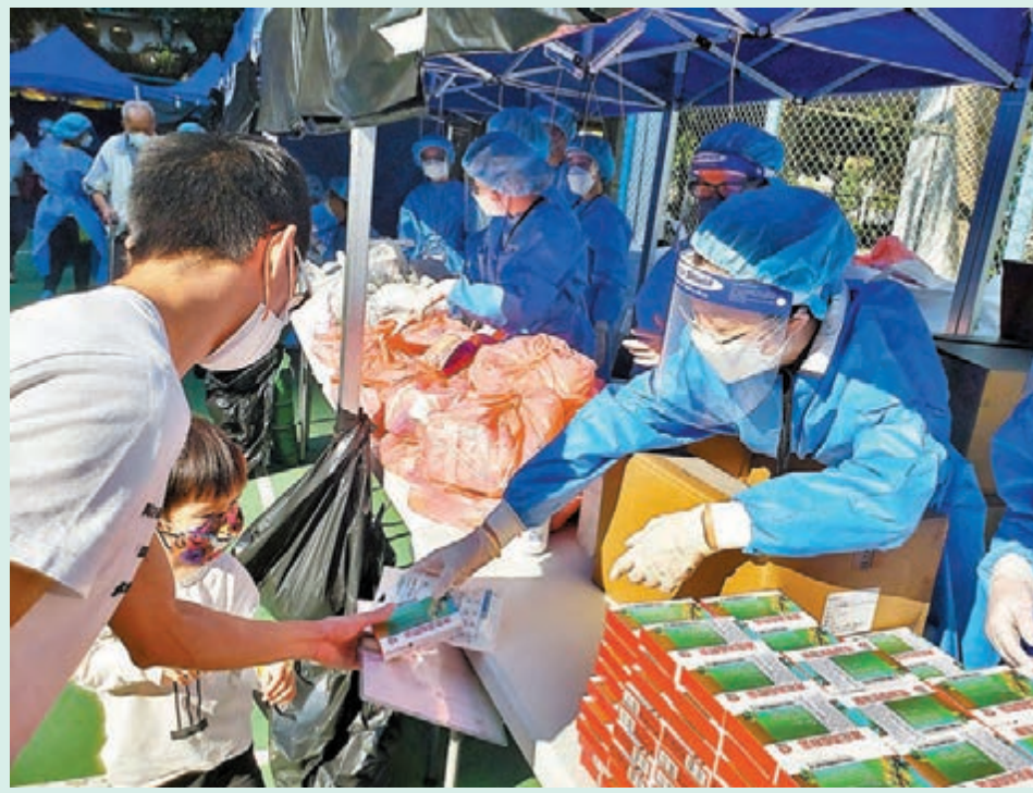
◆財經事務及庫務局轄下多個部門自2月底起動員1,064人，統籌和執行9次「圍封強檢」行動。圖為該局人員向受檢居民派發防疫物資。