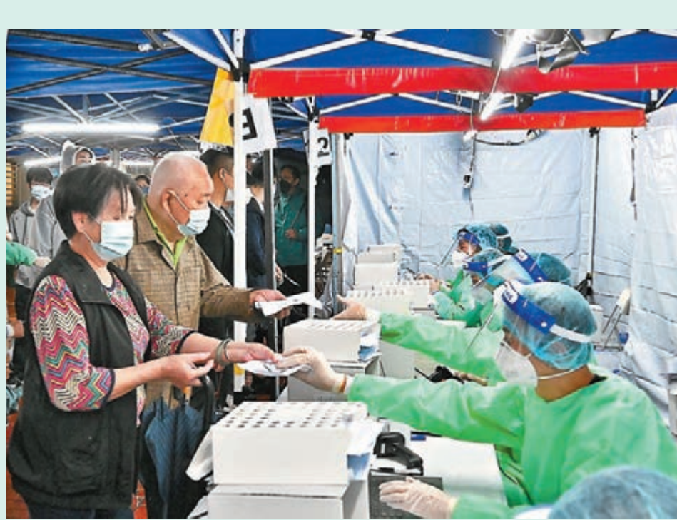
◆勞工及福利局昨日完成在黃大仙指明「受限區域」執行的「圍封強檢」行動。圖為團隊人員前晚為居民登記進行檢測。