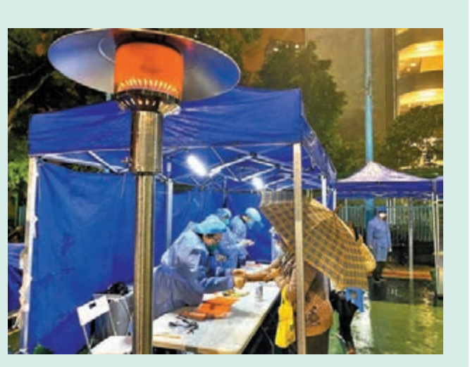
◆黃錦星表示，環保署近期動員超過800名同事，統籌及執行輔助抗疫，如「圍封強檢」等任務。