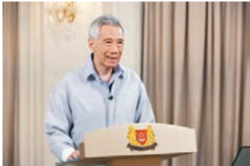
◆ 李顯龍發表電視講話。

新加坡總理李顯龍昨日發表題為「邁入新階段」的全國電視講話，宣布新加坡的抗疫之路進入到一個重要里程碑：從下周起大幅放寬一系列疫情管理措施，包括國內防疫措施及跨境旅遊限制，正式邁向「與病毒共存」階段。不過李顯龍也強調，「共存」不等於全面放寬所有限制，提醒要保持警惕，因為疫情可能還會有出乎意料的發展。