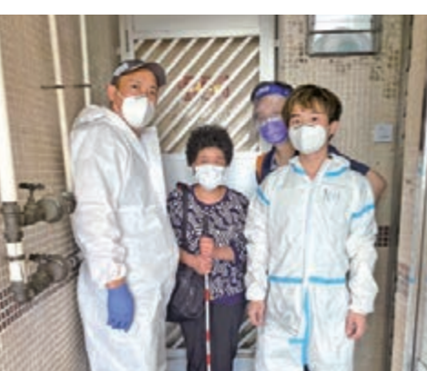
為失明人士之家的公眾場所噴灑消毒塗層。