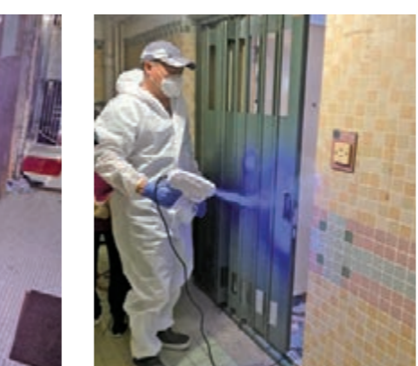
為1100戶基層人士家居消毒。