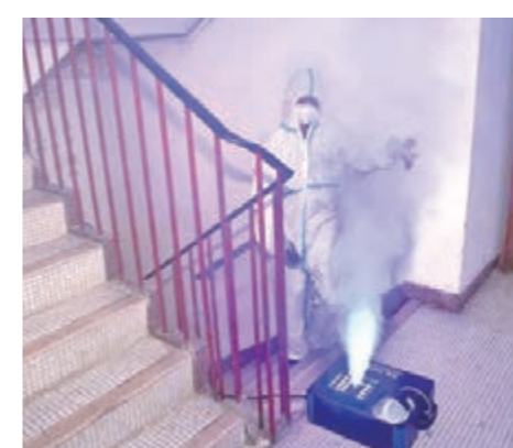
噴灑消毒塗層產生的煙霧。