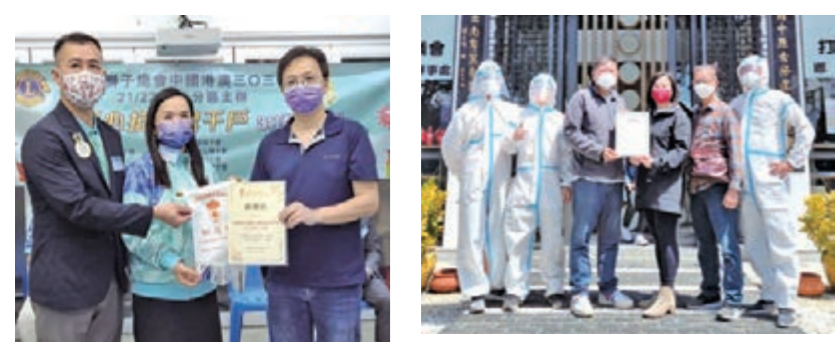
國際獅子總會中國港澳三〇三區向支持及受惠機構頒發紀念狀。

第五波新冠肺炎疫情嚴峻，確診數字和死亡數字持續維持逾萬人數，特區政府實施居家檢疫，大批潛在新冠患者留在社區，防疫衛生成為全城關注焦點，當中全港多區舊式樓宇因為欠缺組織管理導致衛生環境不佳，不少確診市民需要在家隔離，成為防疫黑點，情況令人擔憂。