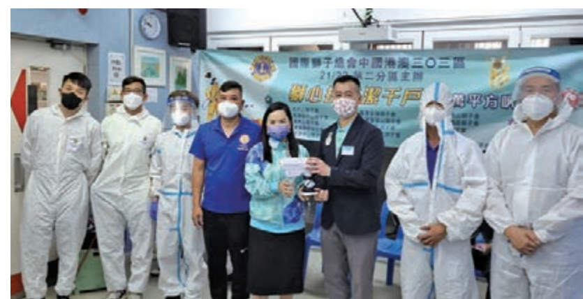
「獅心抗疫潔千戶」啟動禮已於3月11日起展開。