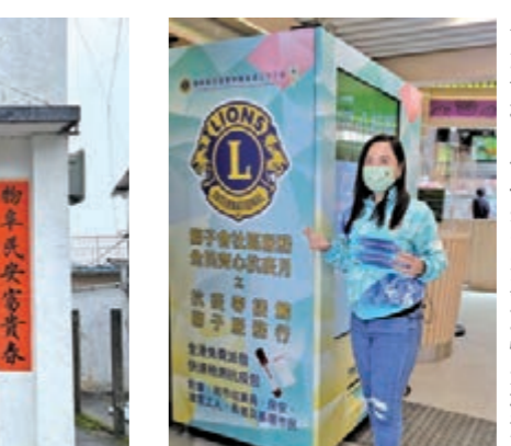
獅子會在全港設置10部自助快速檢測包派發機，供長者免費領取快速檢測包。