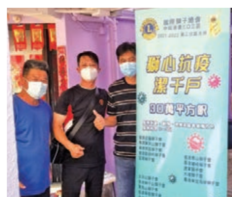
獅子會為沙頭角村民家居噴灑消毒塗層，獲廣泛好評。