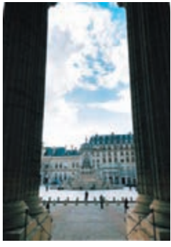
巴黎左岸 St Sulpice 教堂，視野越過中興起巨型噴水池的廣場觀日落，乃不離棄心頭好。

巴黎 Saint Sulpice 教堂 1646：動土年份 1870：完成年份 73：北塔73米高（240英尺） 68：南塔68米高（223英尺） 位置：巴黎左岸6區，面向寬敞 Place Saint Sulpice 廣場 紀念：Sulpitius the Pious 體積：比巴黎至壯觀巴黎聖母院 Notre Dame 略小一點，位居第二大教堂。教堂前廣場60米 x 60米。 筆者上世紀六十年代香港成長，源自新界原居民圍村，成長養分包括絕對中國傳統，混合英殖標準模式；每年春分秋分到宗祠祭祖，清明重陽從新界到深圳、寶安、東莞（甚至有族人遠去老家江西吉水及河南鄧州市）拜祭歷代祖先，問米尋先人，大時大節家人繫綵備節，尊敬長輩（不單止你家中祖父祖母及父母而是整條村子的長輩），兄弟弟恭。小學三年級之前，祖父及父親營商，祖母持家，由母親主政家中數畝田上堅持務農，對鄉下仔耕田佬稱號甘之如飴，由始至終視為人生至珍寶寶藏。 中國人傳統至包容；儒、釋、道並存之外，鬼神並立，村口榕樹頭，河邊幾塊大石頭、拜神婆等等全被膜拜不單止，適齡入學；祠堂村校有之，基督教天主學校有之，或老遠送到市區寄宿由神父主持的名牌學校亦有之，聲譽不太差總之。 佛寺、道觀、教堂照單全收，從青山禪院、靈寶寺、靈隱寺、青松觀、蓬瀛仙觀到杭州靈隱寺、廣州光孝寺、京都清水寺、銀閣寺。 元朗天主教堂、元朗信義會、太子道聖德助撒教堂、花園道聖約翰座堂……到紐約 St Patrick's Cathedral、巴黎聖心教堂、巴黎聖母院、伯利恒耶穌誕生小教堂、翡冷翠 Santa Spirito 到羅馬梵蒂岡聖