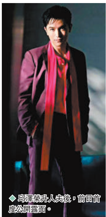
邱澤升人夫後，首度公開露面。