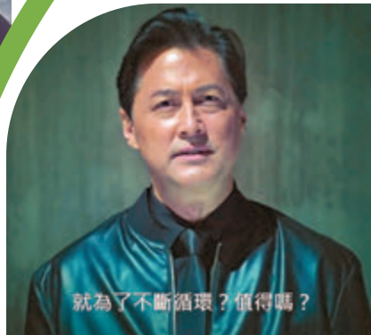
就為了不斷循環？值得嗎？

香港文匯報訊(記者達里)本周進入結局篇的劇集《飛虎3壯志英雄》，劇情講到許俊飛(苗僑偉飾)被嫁禍殺害同伴遭全城通緝，經過一輪調查後，發現幕後黑手原來他的上司Tylor(王敏德飾)，俊飛為還清白誓要捉拿Tylor歸案，在張偉樺(張兆輝飾)的協助下，俊飛潛入Tylor的匿藏基地，但卻誤中對方預設的陷阱險遭炸死，幸好偉樺及時趕到幫他脫險，展博文(馬德鐘飾)也趕到讓他們三兄弟順利逃出生天。