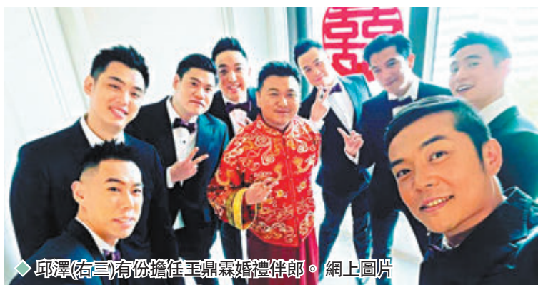
邱澤(右三)有份擔任王鼎霖婚禮伴郎。