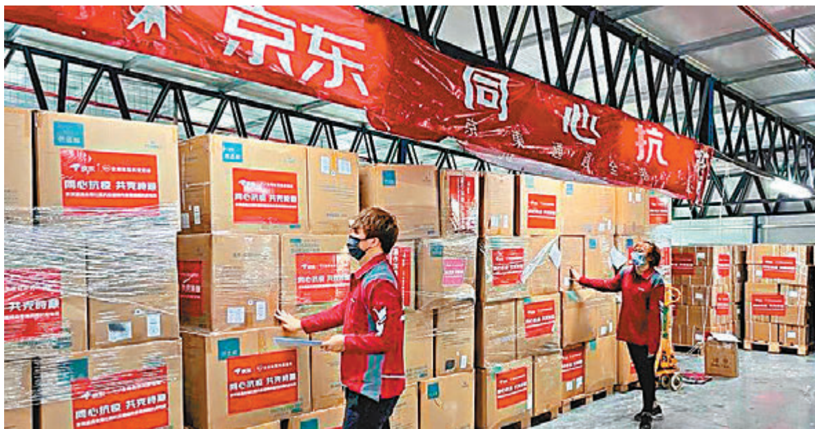
◆京東援助香港抗疫情物資。

疫情以來，社會各界團體全面動員，積極募集抗疫情物資。滙豐銀行捐贈一億元、李嘉誠基金會捐贈7,400萬港元、南豐集團聯同陳廷驊基金會捐贈近