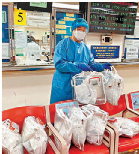
◆義工代求助者在醫院取藥。

香港文匯報訊 香港第五波疫情爆發後，大量確診者因居家檢疫無法外出購買食物和藥物。香港再出發大聯盟獲內地及社會各界捐贈近300萬件物資，在不同機構、團體和義工的協助下，分發到各有需要的人士手上。全港各區數千人的義工團隊，走在抗疫情最前線，為市民上門送藥及食品等物資，成為凝聚社會抗疫情的強大力量。