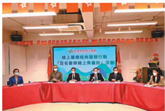
◆「百名醫師線上齊義診」活動啟禮禮。

香港文匯報訊（記者 子京）由「全港抗義工同盟」統籌、多個政團和社團等機構建立的「訊港醫」、微醫等21個線上醫療諮詢服務平台，昨日共同發起「百名醫師線上齊義診」活動，共有139位醫師上線為市民開展中西醫診治及醫學講座等，緩解疫下市民就醫難問題，有3,600多名市民昨日在線上平台進行醫療諮詢、了解醫學信息，有活動方亦為近600位