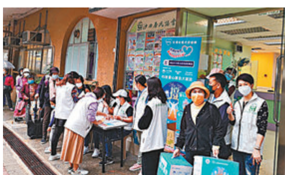
◆義工日前派發「灣區安全應急產業創新聯盟」愛心包。

全民參與守護希望。由香港藝聯聯合創作的《獅子山下 同心抗疫》在社會引起熱烈反響，激發了香港市民團結一致、守護希望、共同抗疫的激情。新世界發展成立全港首個大型捐贈配對網上平台，率先捐出20