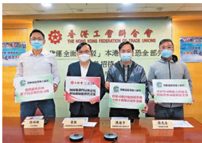
◆工聯會建議，特區政府應向受影響的跨境司機發放「保就業」津貼，提供經濟援助。

與會人士亦促請特區政府汲取第五波的經驗教訓，包括建立香港專家和內地專家交流互通的恒常機制。同時，今次中醫藥業界於抗戰中發揮重要作用，期望特區政府日後能提出具體政策，支持中醫藥業的發展和強化相關宣傳。